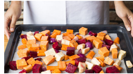
Das Gemüse mit 2EL Olivenöl und je 1 Prise Salz und Pfeffer auf einem mit Backpapier ausgelegten Backblech vermengen und im oberen Teil des Ofens in 25-30Min. goldbraun und gar backen.