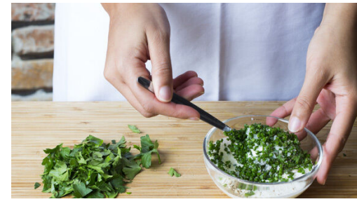
Den Schnittknoblauch in feine Ringe schneiden und mit dem Joghurt verrühren. Den Dip mit Salz und Pfeffer abschmecken. Die Petersilie samt Stängeln grob schneiden.