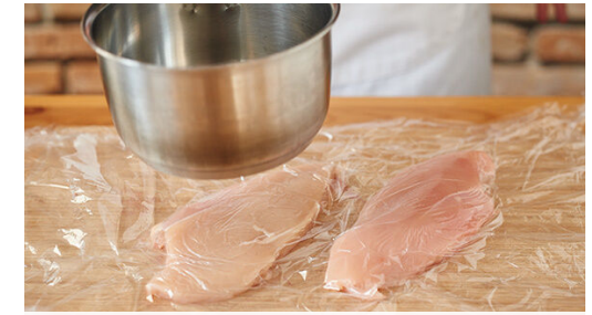
Das Fleisch trocken tupfen, horizontal halbieren und zwischen zwei Lagen Frischhaltefolie mit einem Fleischklopfer, dem Boden einer schweren Pfanne oder dem Boden eines schweren Topfes flach klopfen. Das Fleisch mit 1 EL Olivenöl sowie je 1 Prise Salz und Pfeffer einreiben.