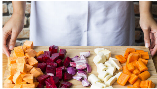
Den Backofen auf 200°C (180°C Umluft) vorheizen. Die Rote Bete schälen und würfeln. Tipp: Da Rote Bete stark färbt, beim Verarbeiten am besten Küchenhandschuhe und Schürze tragen. Die Zwiebel schälen, halbieren und in Spalten schneiden. Die Karotte, die Pastinake und die Süßkartoffel samt Schale in grobe Würfel schneiden.

Allergene Milch (7). Kann Spuren von anderen Allergenen enthalten.