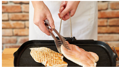
Das Fleisch in einer großen Grillpfanne oder einer normalen Pfanne bei mittlerer bis starker Hitze auf jeder Seite 3-4Min. braten, bis es goldbraun und gar ist. Die Temperatur reduzieren, falls das Fleisch zu schnell bräunt.