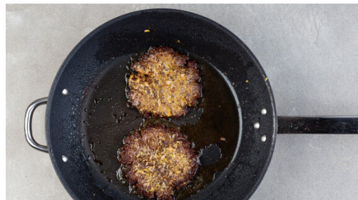
4. Pattys braten

Den Backofen auf 240°C (220°C Umluft) vorheizen. Die Süßkartoffeln samt Schale längs halbieren und in 0,5-1cm dünne, pommesartige Stifte schneiden. Auf einem mit Backpapier ausgelegten Backblech mit 1-2EL Pflanzenöl, ca. 3/4 der Gewürzmischung und je 1 Prise Salz und Pfeffer vermengen, gleichmäßig verteilen und ca. 20Min. im Ofen backen.