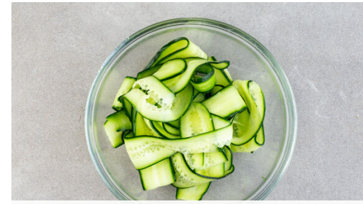
2. Gurke einlegen

In einer großen Pfanne 1EL Pflanzenöl stark erhitzen. Die Kugeln in das heiße Öl geben und sofort mit einem breiten Pfannenwender flach drücken, die entstehenden Pattys sollten max. 1cm dick sein. Die Pattys ohne Wenden 2-3Min. braten, dann die Oberseiten gleichmäßig mit insgesamt 1EL Senf bestreichen. Die Pattys wenden und 2-3Min. weiterbraten, bis das Fleisch durch ist.