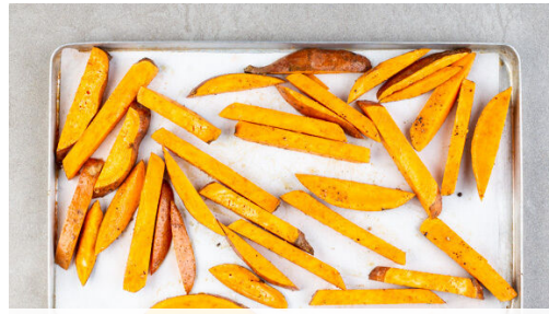
1. Pommes backen

Energie 1150kcal, Fett 71.0g, Kohlenhydrate 79.8g, Eiweiß 48.3g