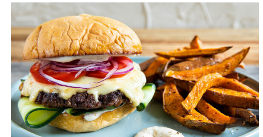
6. Anrichten und servieren

Die Zwiebel schälen und in feine Ringe schneiden. Die Tomate in dünne Scheiben schneiden. 3EL Mayonnaise und 1EL Wasser oder Pflanzenöl mit der restlichen Gewürzmischung nach Geschmack verrühren. Die Brötchen aufschneiden und auf einem zweiten Blech 4-5Min. aufbacken. Das Hackfleisch gut mit 1 kräftigen Prise Salz und Pfeffer verkneten und zu 2 gleich großen Kugeln formen.