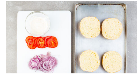
3. Zutaten vorbereiten

Kurz vor Ende der Garzeit die 1/2 des Käses auf den Pattys verteilen, die Pfanne abdecken und den Käse ca. 1Min. schmelzen lassen. Der übrige Käse wird für dieses Rezept nicht benötigt.