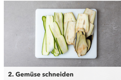
2. Gemüse schneiden

Die Haselnüsse in einer großen Pfanne ohne Zugabe von Fett bei mittlerer Hitze 1-2Min. goldbraun anrösten. Vorsicht , sie können schnell zu dunkel werden. Zum Abkühlen aus der Pfanne nehmen und anschließend grob hacken. Die Pfanne aufbewahren.