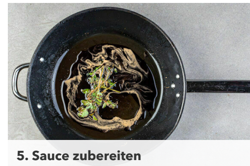
5. Sauce zubereiten

Das Fleisch trocken tupfen, horizontal halbieren und mit je 1 Prise Salz und Pfeffer würzen. In der Pfanne mit 2EL Olivenöl bei mittlerer Hitze auf jeder Seite 2-3Min. anbraten. Sobald das Fleisch in der Mitte durch ist, das Fleisch samt Bratensaft aus der Pfanne nehmen und beiseitestellen.