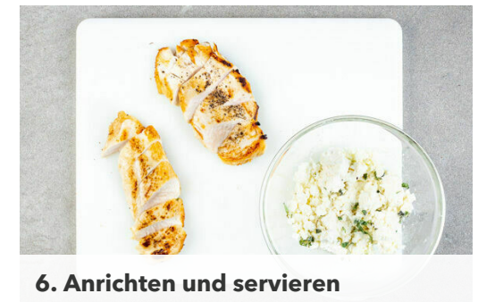
6. Anrichten und servieren

1 Oreganostängel mit 3EL Wasser, 1-2EL Balsamicoessig und 1-2TL Zucker sowie Salz und Pfeffer nach Geschmack in die Pfanne geben und die Sauce bei mittlerer Hitze etwas einkochen lassen. Die Pfanne vom Herd nehmen, das Fleisch samt Bratensaft zurück in die Pfanne geben, gut in der Sauce wenden und anschließend den Oreganostängel entfernen.