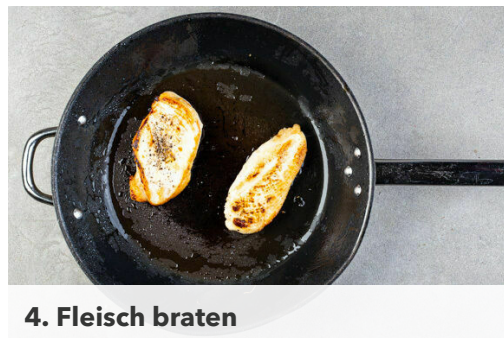
4. Fleisch braten

Die Gemüsescheiben in der Pfanne mit 1EL Olivenöl bei starker Hitze auf jeder Seite 2-3Min. anbraten, bis sie leicht gebräunt sind, dann nach Geschmack mit Salz und Pfeffer würzen. Die Oreganoblätter von 2 Stängeln zupfen, mit 2EL Olivenöl sowie 1EL Balsamicoessig verrühren und das Gemüse untermengen.