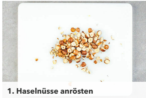
1. Haselnüsse anrösten

Energie 464kcal, Fett 28.2g, Kohlenhydrate 15.7g, Eiweiß 36.9g