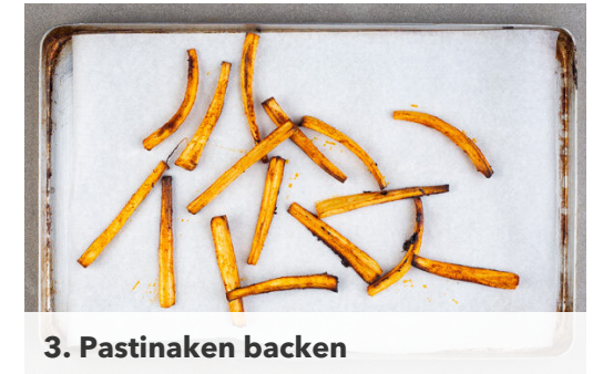
3. Pastinaken backen

Das Brühgewürz in 800ml heißem Wasser auflösen. Die Pilze und die Schalotten in einer großen Pfanne mit 2EL Olivenöl und 1 Prise Salz bei mittlerer bis starker Hitze 3-5Min. goldbraun braten und dann mit 1TL hellem Essig ablöschen. 3/4 der Pilze aus der Pfanne nehmen und beiseitestellen, die restlichen Pilze in der Pfanne lassen.