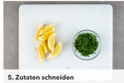
5. Zutaten schneiden

Den Reis und den Knoblauch in die Pfanne zu den Pilzen geben und 1-2Min. anrösten, dann nach und nach mit der Brühe ablöschen und stetig rühren, damit der Reis nicht ansetzt. Diesen Vorgang 18-20Min. lang wiederholen, bis die Brühe aufgebraucht und der Reis bissfest ist. Evtl. etwas mehr Wasser zugeben.