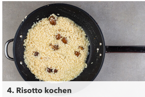
4. Risotto kochen

Die Pastinaken auf einem mit Backpapier ausgelegten Backblech verteilen und im Ofen 15-20Min. goldbraun backen.