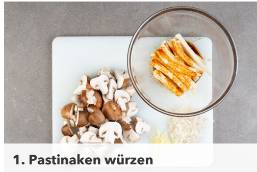
1. Pastinaken würzen

Energie 868kcal, Fett 34.5g, Kohlenhydrate 123.7g, Eiweiß 16.1g