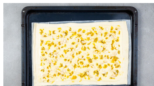
5. Tartes backen

Ca. 2TL Limettenschale fein abreiben, dann die Limette halbieren und auspressen. Die Passionsfrüchte halbieren, das Fruchtfleisch samt Kernen mit einem Löffel auskratzen und die Limettenschale , ca. 2TL Limettensaft sowie 2TL Zucker unterrühren.