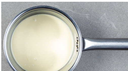
1. Schokolade schmelzen

Energie 1118kcal, Fett 51.3g, Kohlenhydrate 133.5g, Eiweiß 24.0g