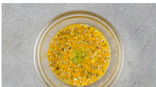
4. Passionsfrucht auslöffeln

Ca. 2TL Limettenschale fein abreiben, dann die Limette halbieren und auspressen. Die Passionsfrüchte halbieren, das Fruchtfleisch samt Kernen mit einem Löffel auskratzen und die Limettenschale , ca. 2TL Limettensaft sowie 2TL Zucker unterrühren.