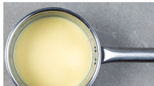
2. Creme zubereiten

Den Backofen auf 220°C (200°C Umluft) vorheizen. Die Schokodrops in einem kleinen Topf bei mittlerer Hitze unter ständigem Rühren schmelzen.