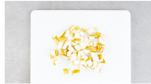
Die Birne vierteln, entkernen und in kleine Würfel schneiden.