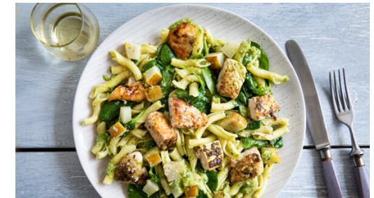
Die Pasta in dem Topf mit dem restlichen Pesto vermengen, dabei nach Bedarf etwas Kochwasser hinzufügen. Den restlichen Spinat unterheben. Die Pasta mit Salz und Pfeffer abschmecken und auf Teller verteilen. Mit dem Hähnchen , den Birnen und dem restlichen Käse garnieren und servieren.