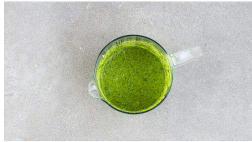
In einem mittelgroßen Topf ausreichend gesalzenes Wasser für die Pasta zum Kochen bringen. Den Knoblauch schälen. Den Käse reiben. Die Kräuter ggf. abzupfen, grob schneiden und mit dem Knoblauch , der 1/2 des Käses , den Pistazien , 1 Handvoll Spinat , 2-3EL Wasser, 2EL Olivenöl, 1EL Essig und 1/2TL Salz in einem hohen Gefäß zu einem glatten Pesto pürieren.

Gluten (1), Milch (7), Nüsse (15). Kann Spuren von anderen Allergenen enthalten.