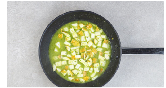
In einer mittelgroßen Pfanne 50ml Wasser mit 2EL Essig und 1TL Pesto erwärmen. Die Flüssigkeit soll sanft sprudeln, aber nicht kochen. Die Birnenwürfel mit 1 Prise Salz und Pfeffer in das Pestowasser geben und abgedeckt in 2-3Min. bissfest ziehen lassen. Vorsichtig in ein Sieb abgießen und auf einem Teller beiseitestellen. Die Pfanne auswaschen.