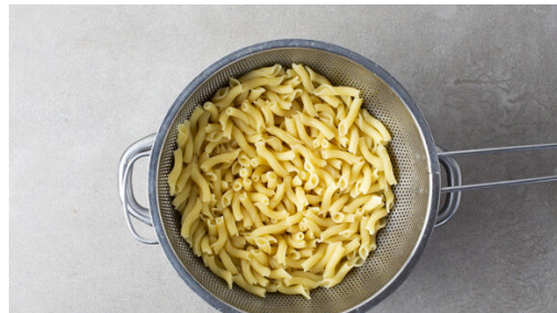
Die Pasta in das kochende Wasser geben und in 6-8Min. bissfest kochen. Mit dem Messbecher etwas Kochwasser abschöpfen, dann die Pasta in ein Sieb abgießen und abtropfen lassen.