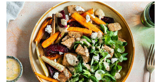
6. Garnieren und servieren

Die Pitabrote in 2-3cm große Stücke schneiden.