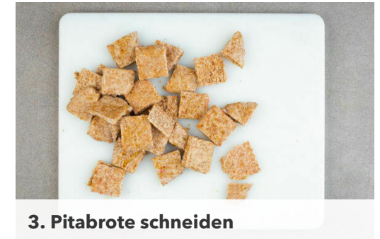
3. Pitabrote schneiden

Das Wurzelgemüse aus dem Ofen nehmen und neben dem Feldsalat auf Tellern anrichten. Die Pitabrotstücke auf dem Backblech verteilen, mit 1EL Olivenöl vermengen und in 3-5Min. zu knusprigen Croûtons backen.