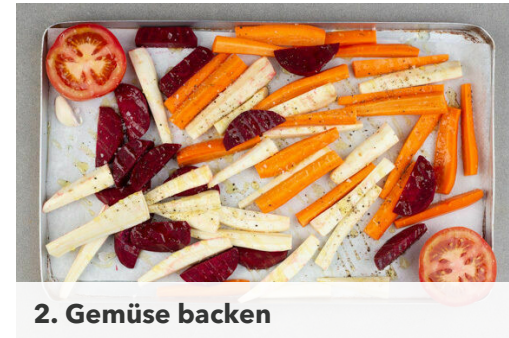
2. Gemüse backen

Die Tomaten und den Knoblauch aus dem Ofen nehmen, den Knoblauch vorsichtig grob schälen. Das Basilikum samt Stängeln grob schneiden. 3/4 des Ziegenfrischkäses in ein hohes Gefäß geben, den Knoblauch , die Tomatenhälften , das Basilikum , 2TL Honig, 2TL hellen Essig sowie je 1 Prise Salz und Pfeffer hinzufügen und mit einem Stabmixer zu einem cremigen Dressing pürieren.