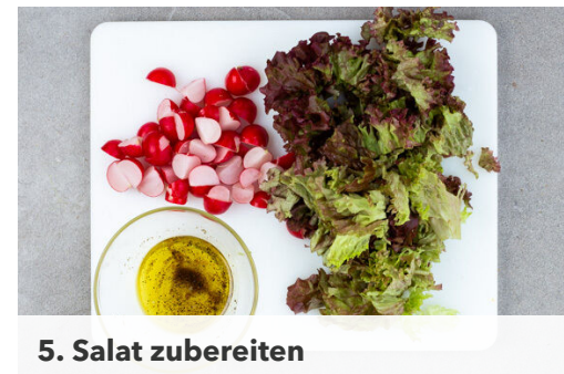
5. Salat zubereiten

In einem mittelgroßen Topf ausreichend gesalzenes Wasser für die Pasta zum Kochen bringen. Die Pasta in das kochende Wasser geben und in 6-8Min. bissfest kochen. 1 Tasse Kochwasser abschöpfen, dann die Pasta in ein Sieb abgießen und abtropfen lassen. Den Topf aufbewahren.