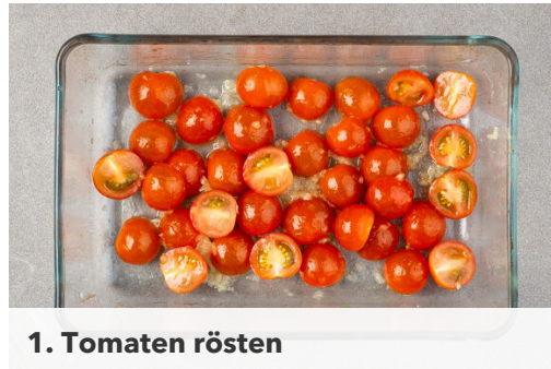
1. Tomaten rösten

Energie 1012kcal, Fett 45.0g, Kohlenhydrate 124.0g, Eiweiß 24.1g