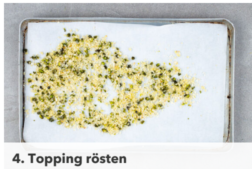
4. Topping rösten

Den Backofen auf 240°C (220°C Umluft) vorheizen. Den Knoblauch schälen und fein würfeln. Die Kirschtomaten halbieren, mit je 1 Prise Salz und Zucker würzen und in eine Auflaufform geben. Den Knoblauch darüber verteilen, mit 1EL Olivenöl beträufeln und ca. 10Min. im Ofen rösten.