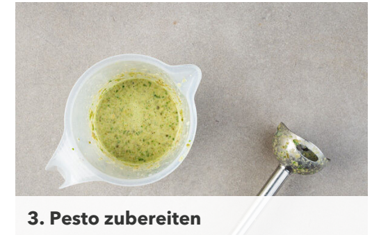
3. Pesto zubereiten

Die Radieschen vierteln. Den Salat vom Strunk befreien und in mundgerechte Stücke schneiden. Aus 2EL Olivenöl, 1EL Essig sowie je 1 kräftigen Prise Salz, Pfeffer und Zucker ein Dressing anrühren und mit dem Salat und den Radieschen vermengen.