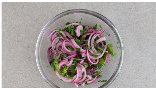
4. Zwiebeln einlegen

Den Backofen auf 220°C (200°C Umluft) vorheizen. Den Knoblauch schälen und fein würfeln. 1,5TL Kreuzkümmel und den Knoblauch in einem mittelgroßen Topf mit 2EL Olivenöl bei mittlerer bis starker Hitze 1-2Min. rösten, bis der Kreuzkümmel leicht gebräunt ist.