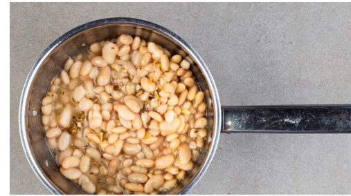
2. Bohnen kochen

Die Zwiebel schälen und eine Hälfte oder mehr nach Geschmack in feine Streifen schneiden. Die Zitrone halbieren und auspressen. Die Zwiebelstreifen mit 1TL Zitronensaft und 1 kräftigen Prise Salz vermengen, das Salz mit den Händen einmassieren. Die Petersilie samt Stängeln grob schneiden. Die Zwiebeln mit der Petersilie vermengen und beiseitestellen.