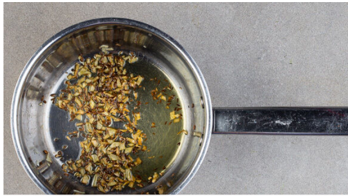
1. Kreuzkümmel rösten

Energie 728kcal, Fett 28.2g, Kohlenhydrate 75.7g, Eiweiß 31.3g