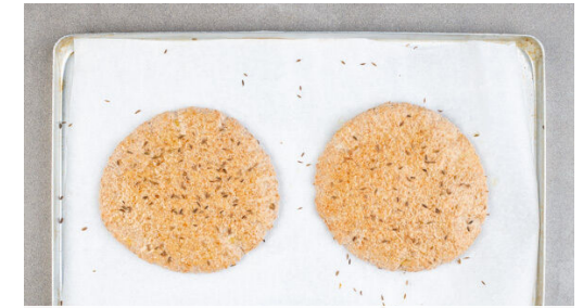
3. Pitabrote backen

Die Kirschtomaten in einer mittelgroßen Pfanne mit 1TL Olivenöl bei starker Hitze 3-4Min. anbraten, bis sie zu bräunen beginnen und aufplatzen, dabei gelegentlich umrühren. Die Gurke mit einem Sparschäler rundherum in dünne, breite Streifen schneiden.