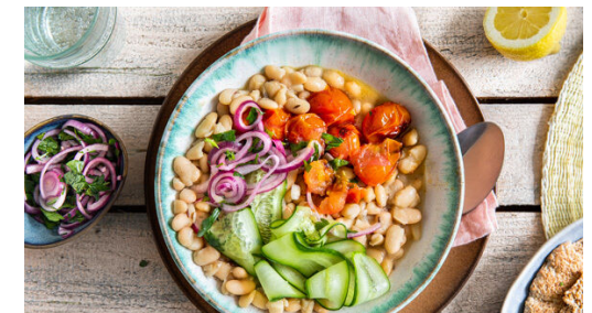
6. Fertigstellen & servieren

2 Pitabrote mit 1EL Olivenöl bepinseln, dann mit dem restlichen Kreuzkümmel und 1 Prise Salz bestreuen. Die Pitabrote auf einem mit Backpapier ausgelegten Backblech im mittleren Teil des Ofens ca. 8Min. backen. Tipp: Die übrigen Pitas einfrieren und für ein anderes Rezept verwenden.