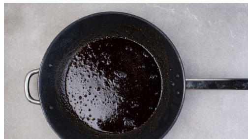
4. Sauce zubereiten

In einem mittelgroßen Topf ausreichend gesalzenes Wasser für das Gemüse zum Kochen bringen. Die Karotten ggf. schälen und in 1-2cm große Stücke schneiden. Die 1/2 des Lauchs längs halbieren und in dünne Streifen schneiden. Die Kartoffeln schälen und in 2-3cm große Stücke schneiden.