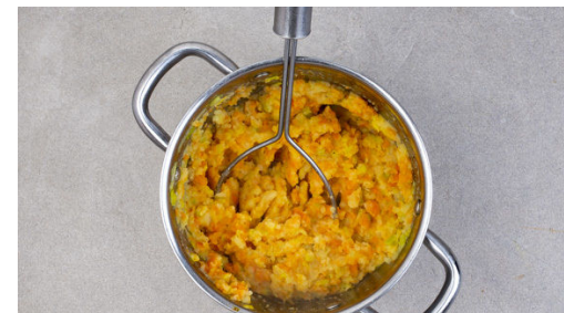
5. Gemüse stampfen

Die Karotten , den Lauch und die Kartoffeln in das kochende Wasser geben und 12-15Min. kochen. Die Cranberrys in 200ml heißem Wasser ca. 5Min. einweichen, dann mit dem Ketjap Manis in einem hohen Gefäß cremig pürieren.