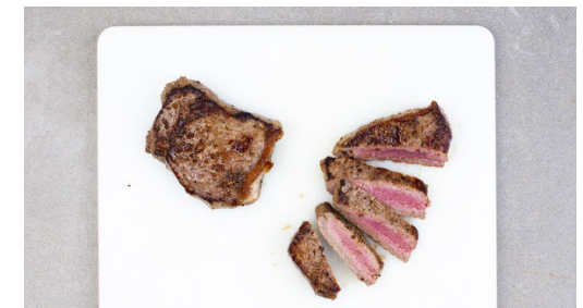
6. Fleisch schneiden

Das Fleisch trocken tupfen und in einer mittelgroßen Pfanne mit 1EL Olivenöl bei starker Hitze auf jeder Seite 3-4Min. scharf anbraten. Aus der Pfanne nehmen, nach Belieben mit Salz und Pfeffer würzen und bis zum Servieren auf einem Teller abgedeckt ruhen lassen.