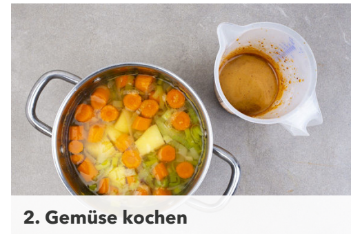
2. Gemüse kochen

Die Cranberrysauce in die Pfanne geben und aufkochen lassen. Tipp: Wer mag, kann 1EL Butter dazugeben. Mit Salz und Pfeffer abschmecken und etwas eindicken lassen.