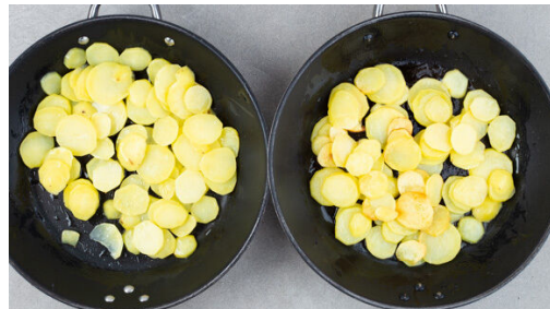
Die Kartoffelscheiben in zwei großen Pfannen mit je 2EL Olivenöl bei mittlerer bis starker Hitze 16–20Min. goldbraun anbraten. Tipp: Die Kartoffeln dabei gut schwenken, sodass sie gleichmäßig und schön bräunen. Zum Schluss mit Salz und Pfeffer würzen.