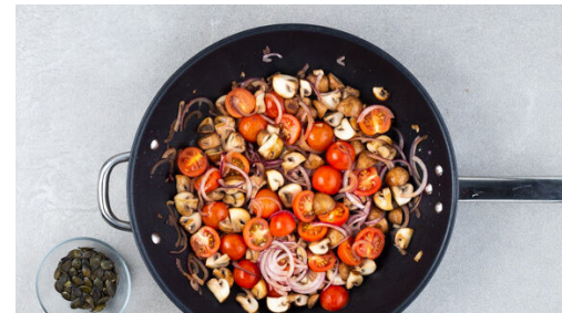
Die restlichen Kürbiskerne in einer mittelgroßen Pfanne ohne Zugabe von Fett bei mittlerer Hitze 2-4Min. anrösten, bis sie knistern und goldbraun sind. Zum Abkühlen aus der Pfanne nehmen. Die Pilze in derselben Pfanne mit 1EL Olivenöl 3-4Min. anbraten. Die Tomaten und die Zwiebeln dazugeben und 2-3Min. mitbraten, dann mit Salz und Pfeffer abschmecken.