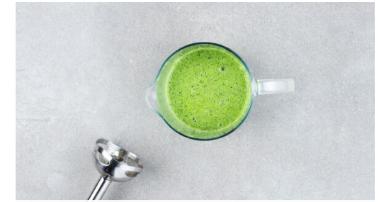
Ca. 1/4 des Rucolas , das Basilikum samt Stängeln , den Knoblauch und die 1/2 der Kürbiskerne mit 2EL Olivenöl, 2EL hellem Essig und 3-4EL Wasser in einem hohen Gefäß zu einem cremigen Pesto-Dressing pürieren. Mit Salz und Pfeffer abschmecken.