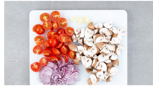
Die Pilze ggf. säubern und je nach Größe vierteln oder sechsteln. Die Kirschtomaten halbieren. Die Zwiebel schälen, halbieren und in dünne Streifen schneiden. Den Knoblauch schälen und grob würfeln.