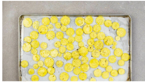
1. Gelbe Bete backen

Energie 604kcal, Fett 27.4g, Kohlenhydrate 63.8g, Eiweiß 19.6g