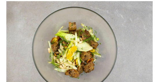
6. Salat fertigstellen

Die Bohnen in einem Sieb kalt abspülen und abtropfen lassen. Den Fenchel in dünne Streifen schneiden. Die Lauchzwiebeln in feine Ringe schneiden. Tipp: Sehr dekorativ wirkt es, wenn die Lauchzwiebeln schräg geschnitten werden.