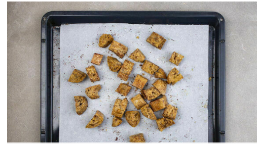
2. Brot rösten

Den Fenchel in einer großen Pfanne mit 1EL Olivenöl bei mittlerer Hitze 5-7Min. braten, bis er anfängt, weich zu werden. Die Bohnen zufügen und 2-3Min. mitgaren. Die Pfanne vom Herd nehmen und das Gemüse mit Salz und Pfeffer abschmecken.