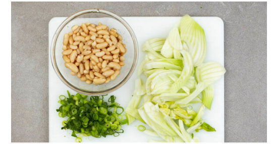
3. Zutaten vorbereiten

Die Schale einer Orange abreiben, dann die Orange halbieren und auspressen. Die übrigen Orangen so schälen, dass auch die weiße Haut entfernt wird, und das Fruchtfleisch in Spalten schneiden. Den Dill samt Stängeln fein schneiden.