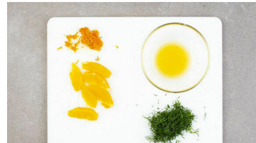
5. Orangen vorbereiten

Die Brötchen grob würfeln und auf einem zweiten mit Backpapier ausgelegten Backblech mit 2EL Olivenöl, dem Sumach und je 1 Prise Salz und Pfeffer vermengen. Im Ofen in 6-8Min. knusprig backen, nach der Hälfte der Backzeit wenden.