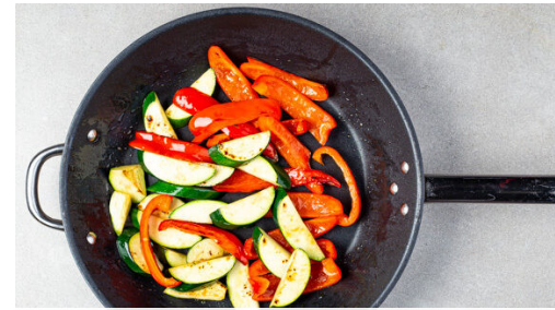
2. Gemüse braten

Das Fleisch in einer mittelgroßen Pfanne bei starker Hitze auf der Fettseite 2-4Min. scharf anbraten. Wenden und weitere 2-4Min. braten, je nach Dicke des Fleisches. Die Hitze reduzieren, das Fleisch 1-3Min. abgedeckt garen, je nachdem, ob es medium oder durch sein soll. Nach Geschmack mit Salz und Pfeffer würzen, abgedeckt 3-4Min. auf einem Teller ruhen lassen und in Tranchen schneiden.