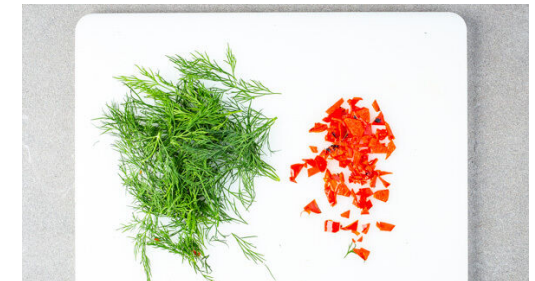
6. Peperoni & Dill schneiden

Das Fleisch trocken tupfen, dann rundum mit der Gewürzmischung und 1EL Olivenöl einreiben.