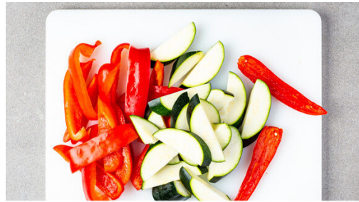
1. Gemüse schneiden

Energie 479kcal, Fett 31.8g, Kohlenhydrate 14.1g, Eiweiß 35.6g