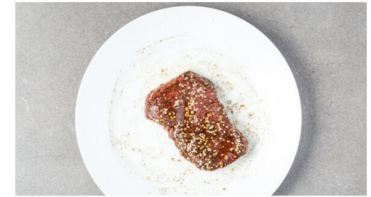
3. Fleisch würzen

Den Knoblauch schälen und mit der 1/2 des Joghurts , 1EL Olivenöl, 1EL Essig oder mehr nach Geschmack in einem hohen Gefäß mit einem Stabmixer zu einer glatten Sauce pürieren und mit Salz und Pfeffer abschmecken.