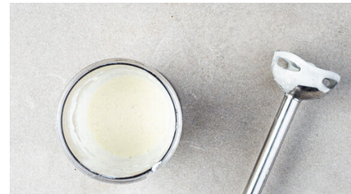
5. Sauce zubereiten

Das Gemüse und die Peperoni in einer großen Pfanne mit 1EL Olivenöl und je 1 Prise Salz und Pfeffer bei mittlerer bis starker Hitze 6-8Min. goldbraun braten.