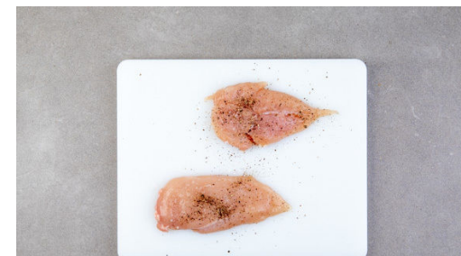
3. Fleisch vorbereiten

Die getrockneten Tomaten in feine Streifen schneiden. Den Käse fein reiben.