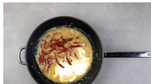
5. Sauce ansetzen

Das Fleisch in einer großen Pfanne mit 1-2EL Olivenöl bei starker Hitze auf jeder Seite 1-2Min. scharf anbraten. Das Fleisch samt Bratensatz aus der Pfanne nehmen und auf einem Teller ruhen lassen.