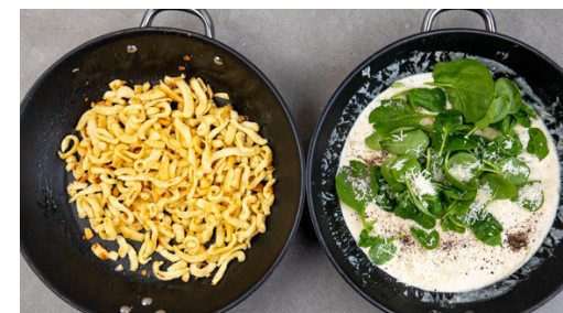
6. Spätzle braten

Die Zwiebeln und den Knoblauch in derselben Pfanne mit 1-2EL Olivenöl bei mittlerer Hitze 1-2Min. anbraten. Mit 2EL Mehl bestäuben und mit 500ml Wasser ablöschen, dann das Brühgewürz unterrühren. Die getrockneten Tomaten , die Crème fraîche und das Fleisch samt Bratensatz hinzugeben und alles 4-5Min. sanft köcheln lassen.