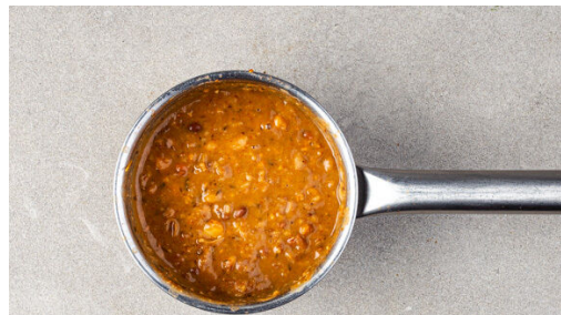
Die Bohnen samt Flüssigkeit mit der Gewürzmischung in einem kleinen Topf bei mittlerer Hitze zum Kochen bringen. Dann bei niedriger Hitze 5-8Min. einköcheln lassen, bis etwa die Hälfte der Flüssigkeit verdampft ist, dabei gelegentlich umrühren. Die Bohnen im Topf grob zerdrücken und mit Salz und Pfeffer abschmecken.

Gluten (1), Eier (3), Milch (7). Kann Spuren von anderen Allergenen enthalten.