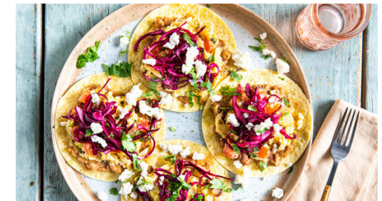
Die Bohnen auf den Tortillas verteilen, dann die Eier-Tomaten-Mischung gefolgt von dem Rotkohlsalat darauf anrichten und den Feta mit den Händen darüber zerkrümeln. Die Tacos mit dem restlichen Koriander garnieren und servieren.