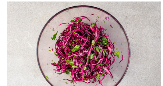
Die Limettenschale abreiben, dann die Limette halbieren und auspressen. Den Rotkohl mit dem Limettensaft , der 1/2 der Limettenschale , 1EL Essig, 1-2TL Olivenöl und 1/2TL Salz vermengen. Den Koriander samt Stängeln grob schneiden und die 1/2 des Korianders mit dem Salat vermengen. Nach Geschmack mit Salz und Pfeffer verfeinern.