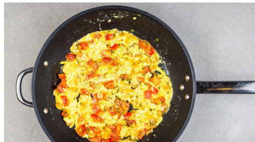
Die Tomaten in die Pfanne zu den Zwiebeln geben und 3-4Min. mitbraten. Die Eier mit 2EL Milch und der restlichen Limettenschale verquirlen, dann in die Pfanne geben, mit den Tomaten vermengen und ca. 3Min. mitbraten. Mit Salz und Pfeffer abschmecken.