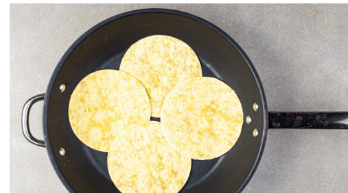
Die Tortillas nacheinander in einer zweiten großen Pfanne bei mittlerer Hitze auf jeder Seite ca. 15Sek. erwärmen.