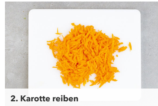
2. Karotte reiben

In einem mittelgroßen Topf ausreichend gesalzenes Wasser für die Nudeln zum Kochen bringen. Die Paprika halbieren, entkernen und in dünne Streifen schneiden. Die Lauchzwiebeln schräg in feine Ringe schneiden.