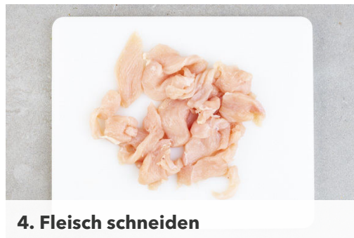
4. Fleisch schneiden

Die Nudeln in das kochende Wasser geben und in 3-5Min. bissfest kochen. In ein Sieb abgießen und kalt abschrecken.