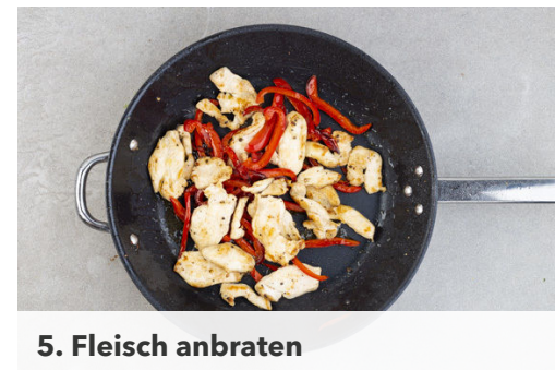
5. Fleisch anbraten

Das Fleisch trocken tupfen, längs halbieren und quer in dünne Scheiben schneiden.