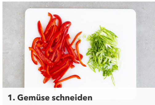
1. Gemüse schneiden

Energie 854kcal, Fett 24.4g, Kohlenhydrate 105.8g, Eiweiß 49.5g