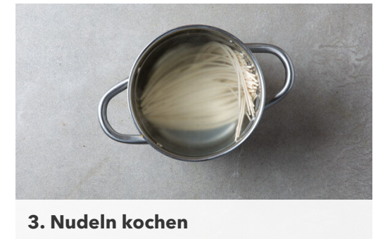
3. Nudeln kochen

Die Karotte ggf. schälen und mit einer Küchenreibe grob raspeln.