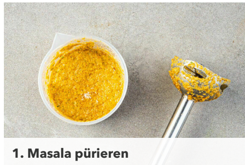
1. Masala pürieren

Energie 1061kcal, Fett 42.0g, Kohlenhydrate 135.1g, Eiweiß 26.4g