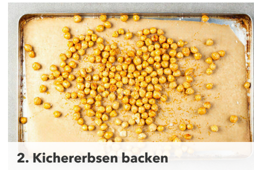
2. Kichererbsen backen

Verzichte auf gedruckte Rezepte - ändere die Einstellungen im Kundenkonto. Fragen zur Zubereitung oder zum Rezept? Deine Koch-Hotline: 030 208 480 510