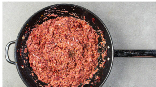
4. Pachadi zubereiten

Den Backofen auf 220°C (200°C Umluft) vorheizen. Den Knoblauch und den Ingwer schälen und grob schneiden, die Peperoni ebenfalls grob schneiden und in einem hohen Gefäß mit der 1/2 der Gewürzmischung , der 1/2 des Korianders samt Stängeln , 3/4 der Kokosflocken , 1TL Salz, 2EL Pflanzenöl sowie 1EL Wasser mit einem Stabmixer zu einer Masala-Paste pürieren.