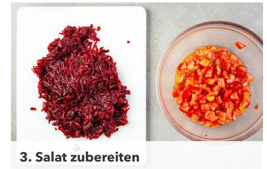
3. Salat zubereiten

Das Naanbrot ca. 5Min. im Ofen aufbacken, nach der Hälfte der Zeit das Brot wenden. Den restlichen Koriander samt Stängeln fein schneiden. Die Limette in Spalten schneiden.