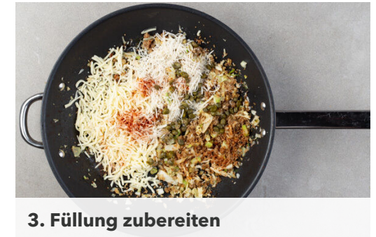
3. Füllung zubereiten

Den Fenchel und den Knoblauch in einer großen Pfanne mit 3EL Olivenöl und 1/2TL Salz bei mittlerer Hitze ca. 5Min. braten. Die Paprika längs halbieren und entkernen. Den Käse fein reiben.