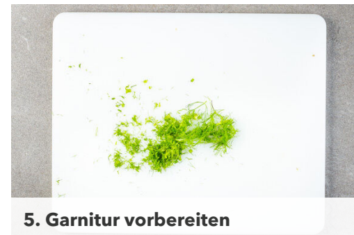
5. Garnitur vorbereiten

Die Außenseiten der Paprikahälften mit 1EL Olivenöl bepinseln, mit je 1 Prise Salz und Pfeffer würzen und mit der Quinoa-Mischung füllen, übrige Füllung abgedeckt warm halten. Die Paprikahälften im Ofen in 22-28Min. goldbraun backen. Tipp: Wer die Paprika weicher mag, kann sie noch etwas länger im Ofen lassen.