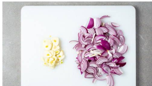
1. Zwiebeln schneiden

Energie 661kcal, Fett 45.8g, Kohlenhydrate 26.1g, Eiweiß 36.5g