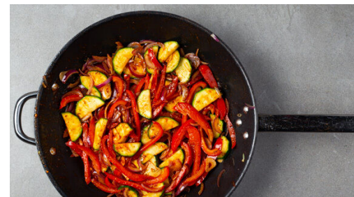
5. Gemüse braten

Das Fleisch trocken tupfen, quer halbieren und mit 1 Prise Salz und Pfeffer würzen. In einer mittelgroßen Pfanne mit 1EL Olivenöl bei starker Hitze auf der Fettseite 2-4Min. scharf anbraten. Wenden und weitere 2-4Min. braten, je nach Dicke des Fleisches . Die Hitze reduzieren und das Fleisch 1-3Min. abgedeckt garen, bis es medium oder durch ist. Abgedeckt auf einem Teller ruhen lassen.