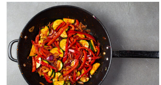
6. Anrichten und servieren

Die Zwiebeln , die Zucchini und die Paprika in einer großen Pfanne mit 1EL Olivenöl bei starker Hitze 3-4Min. anbraten. Dann den Knoblauch , die Tomaten und 1-2EL Ketchup hinzufügen. Erneut ca. 3Min. braten, bis das Gemüse gar, aber noch bissfest ist. Mit der Gewürzmischung und je 1 kräftigen Prise Salz und Pfeffer abschmecken.