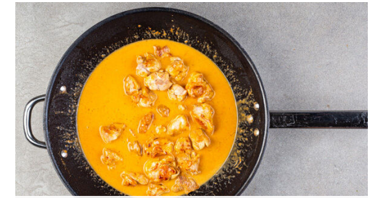
3. Curry zubereiten

Das Gemüse mit 2EL Pflanzenöl, 3-4EL Essig und 1 kräftigen Prise Salz vermengen. Den Koriander samt Stängeln grob schneiden.