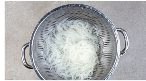
2. Nudeln garen

Die Rote Bete schälen und mit einer Küchenreibe grob raspeln, dabei am besten Küchenhandschuhe und Schürze tragen. Die Karotten ggf. schälen und grob raspeln.