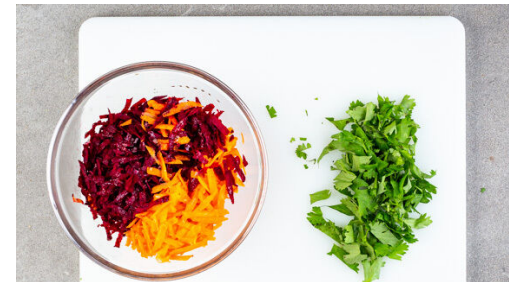
5. Salat zubereiten

Die Nudeln in das kochende Wasser geben, den Topf vom Herd nehmen und die Nudeln 3-5Min. gar ziehen lassen. In ein Sieb abgießen, kalt abschrecken und abtropfen lassen. Tipp: Um die Weiterverarbeitung zu erleichtern, ggf. die Nudeln mit einer sauberen Schere 1-2 Mal durchschneiden.