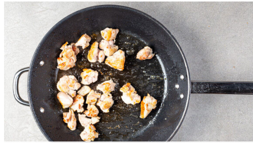
1. Fleisch anbraten

Energie 988kcal, Fett 59.0g, Kohlenhydrate 64.8g, Eiweiß 46.6g