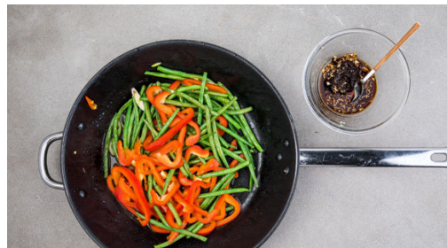
4. Gemüse braten

Den Tofu in ca. 2cm große Stücke schneiden und mit 2EL Mehl, 1 Prise Salz und Pfeffer vermengen. In einer großen Pfanne mit 2EL Pflanzenöl bei mittlerer Hitze 3-4Min. anbraten, dann wenden und weitere 3-4Min. knusprig anbraten. Auf einem Teller beiseitestellen, die Pfanne aufbewahren. In einem großen Topf ausreichend gesalzenes Wasser für die Nudeln zum Kochen bringen.