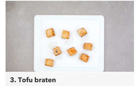
3. Tofu braten

Die Enden der Bohnen abschneiden. Die Paprika vierteln, entkernen und in dünne Streifen schneiden. Die Lauchzwiebel schräg in feine Ringe schneiden, dabei die grünen und weißen Lauchzwiebelringe trennen.