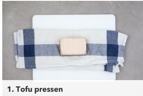
1. Tofu pressen

Energie 613kcal, Fett 12.5g, Kohlenhydrate 98.9g, Eiweiß 24.1g