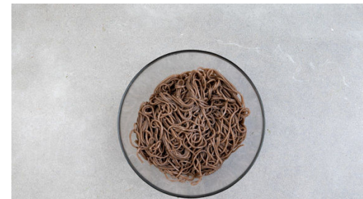
5. Nudeln kochen

Die Bohnen , die Paprika und die weißen Lauchzwiebelringe mit einem Spritzer Wasser in der Pfanne 2-3Min. anbraten, dann abgedeckt 4-5Min. garen. In der Zwischenzeit den Knoblauch schälen, fein reiben oder würfeln und mit der Bohnsauce , der Sojasauce und 2-3EL (hellem) Essig zu einer Würzsauce verrühren.