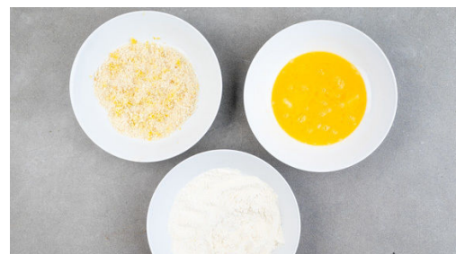
5. Panade vorbereiten

Die Zucchini in ca. 0,5cm dünne Scheiben schneiden und mit den Oliven zum Tomatensugo geben. Bei niedriger Hitze 5-8Min. mitköcheln lassen, bis die Kartoffeln gar sind. Die Zitronenschale abreiben, dann die Zitrone halbieren und in Spalten schneiden.