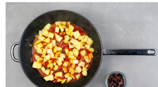
3. Kartoffeln mitgaren

Die Zwiebeln und die 1/2 des Knoblauchs in einer großen Pfanne mit 1EL Pflanzenöl bei mittlerer Hitze 1-2Min. anbraten. Die gehackten Tomaten mit der 1/2 des Brühgewürzes oder mehr in die Pfanne geben. Die Sauce sanft köcheln lassen und mit dem Rosmarin nach Geschmack sowie je 1 Prise Salz, Pfeffer und Zucker würzen.