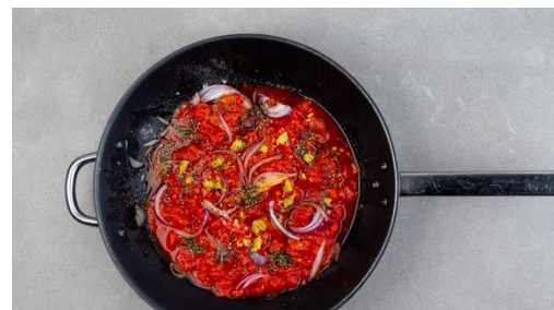
2. Tomatensugo kochen

Die Zwiebel schälen, halbieren und in feine Streifen schneiden. Die Rosmarinnadeln abzupfen und fein hacken. Den Knoblauch schälen und sehr fein würfeln oder durch eine Knoblauchpresse drücken.