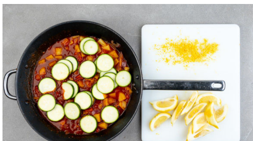
4. Zucchini schneiden

Die 1/2 der Kartoffeln schälen, in ca. 1cm große Würfel schneiden und in den Tomatensugo geben. Die restlichen Kartoffeln werden für dieses Rezept nicht benötigt. Abgedeckt ca. 10-12Min. bei niedriger bis mittlerer Hitze köcheln lassen. Bei Bedarf etwas Wasser hinzufügen. Die Oliven in dünne Scheiben schneiden.