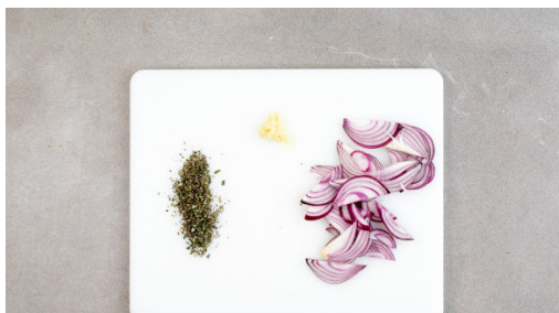
1. Zwiebel schneiden

Energie 833kcal, Fett 37.6g, Kohlenhydrate 78.3g, Eiweiß 43.9g