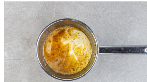
5. Karamellsauce zubereiten

Die Zitrone halbieren und auspressen. Die 1/2 des Zitronensafts in einer großen Schüssel mit 1-2EL Honig, 2EL Zucker und 2EL Mehl verrühren.