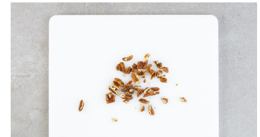
6. Nüsse hacken

Die Birnen und die Äpfel vierteln, entkernen und in dünne Scheiben schneiden. Das Obst mit der Honig-Zitronen-Mischung vermengen.