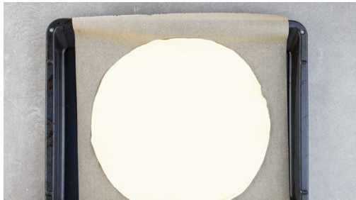
1. Teige ausrollen

Energie 648kcal, Fett 40.4g, Kohlenhydrate 65.0g, Eiweiß 6.9g