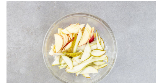
3. Obst vorbereiten

In einem kleinen Topf 6EL Zucker und 2EL Wasser langsam erhitzen, bis der Zucker eine hellbraune Farbe angenommen hat. 100ml Schlagsahne , 50g Butter, 1 Prise Salz und 1 Rosmarinzwig hinzufügen und die Sauce 6-10Min. sanft köcheln lassen, bis sich der Karamell vollständig aufgelöst hat. Den Rosmarinzwig entfernen und die Sauce etwas abkühlen lassen.