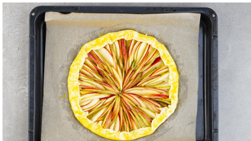
4. Teige belegen

Den Backofen auf 190°C Umluft (210°C Ober-/Unterhitze) vorheizen. Die Teige mit dem Papier nach unten auf zwei Backblechen ausrollen.