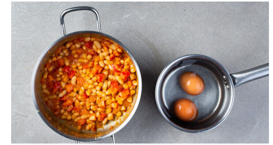
Die Eier in das kochende Wasser geben und ca. 6Min. weich kochen (oder ca. 8Min. für härtere Eier ), danach unter fließendem Wasser kalt abschrecken. 1/4 der Tomaten samt Saft mit der Misopaste , dem Sambal Oelek , den Bohnen und 1EL Wasser in die Pfanne geben und bei mittlerer bis niedriger Hitze 7-8Min. köcheln lassen, bis die Bohnen weich sind.