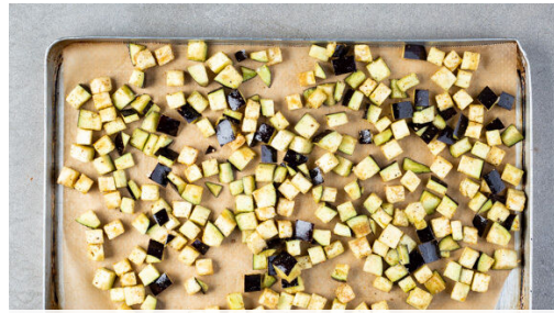
Den Backofen auf 220°C (200°C Umluft) vorheizen. Die Aubergine in ca. 1cm große Würfel schneiden und mit der Gewürzmischung , 2EL Olivenöl sowie 1 Prise Salz vermengen. Die Auberginen auf einem mit Backpapier ausgelegten Backblech im Ofen 20-25Min. goldbraun backen, nach der Hälfte der Zeit wenden.

Energie 828kcal, Fett 33.5g, Kohlenhydrate 97.0g, Eiweiß 29.3g