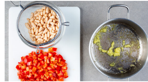
In einem kleinen Topf ausreichend Wasser für die Eier zum Kochen bringen. Die Tomaten in ca. 1cm große Würfel schneiden. Den Ingwer und den Knoblauch schälen, fein würfeln und in einer mittelgroßen Pfanne mit 1EL Olivenöl bei mittlerer Hitze 1-2Min. anbraten. Die Bohnen in ein Sieb abgießen und abtropfen lassen.