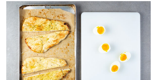
Das Naanbrot ca. 4Min. im Ofen erwärmen, zwischendurch einmal wenden. Die Eier schälen und halbieren. Das Miso-Auberginen-Gemüse mit dem Tomatensalat , den Eiern und dem Naanbrot auf Teller verteilen und mit den Kokosflocken garniert servieren.