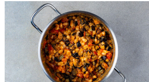
Einen Teil der Bohnen mit einem Kartoffelstampfer oder einer Gabel zerdrücken. Die Auberginen hinzufügen und danach die Pfanne vom Herd nehmen.