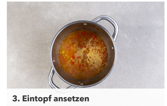
3. Eintopf ansetzen

Das Fleisch in einer großen Pfanne mit 1-2EL Olivenöl bei mittlerer bis starker Hitze 2-3Min. scharf anbraten. Die Hitze reduzieren und das Fleisch mit dem Limettensaft ablöschen und die Limettenschale unterrühren.