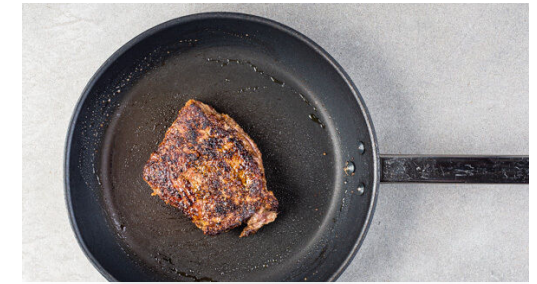
3. Fleisch braten

Die Bohnen in einem Sieb mit kaltem Wasser abspülen und abtropfen lassen. Die Lauchzwiebel in dünne Ringe schneiden. Die Bohnen und 3/4 der Lauchzwiebeln mit den Karotten , der Paprika , den Tomaten und dem Erdnussdressing vermengen.