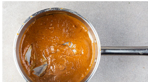
4. Dressing zubereiten

Die 1/2 des Currypulvers mit 1TL Pflanzenöl sowie je 1 Prise Salz und Pfeffer verrühren. Das Fleisch trocken tupfen, mit dem Gewürzöl einreiben und beiseitestellen.