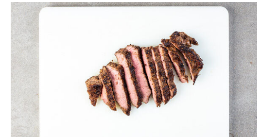
6. Fleisch tranchieren

Das Fleisch in einer mittelgroßen Pfanne mit 1EL Pflanzenöl bei starker Hitze auf jeder Seite 2-4Min. scharf anbraten, je nach Dicke des Fleisches . Die Hitze reduzieren und das Fleisch noch 1-3Min. abgedeckt garen, je nachdem, ob es medium oder durch sein soll. Das Fleisch abgedeckt auf einem Teller ruhen lassen.