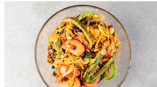
5. Salat mischen

Die Karotte ggf. schälen und grob raspeln. Die Paprika vierteln, entkernen und in dünne Streifen schneiden. Die Karotten und die Paprika mit 1/2TL Salz und 1EL (hellem) Essig vermengen und beiseitestellen. Die Tomaten in Spalten schneiden.