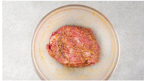
1. Fleisch würzen

Energie 659kcal, Fett 31.8g, Kohlenhydrate 36.3g, Eiweiß 47.5g