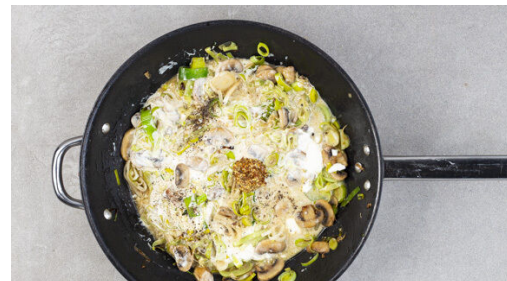
5. Geschnetzeltes zubereiten

Das Fleisch in einer großen Pfanne mit 1EL Olivenöl bei starker Hitze 3-4Min. goldbraun anbraten. Aus der Pfanne nehmen und beiseitestellen.