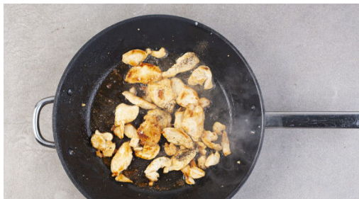
4. Fleisch anbraten

Das Fleisch trocken tupfen und in 1-2cm dicke Streifen schneiden, mit je 1 Prise Salz und Pfeffer würzen.