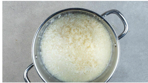
1. Blumenkohlreis kochen

Energie 432kcal, Fett 27.5g, Kohlenhydrate 26.1g, Eiweiß 22.4g