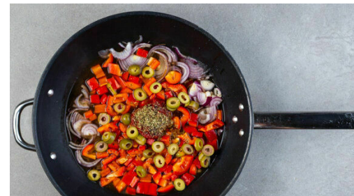
5. Sauce köcheln

Den Knoblauch schälen und fein würfeln. Den Blumenkohlreis auf ein sauberes Baumwolltuch geben und mit den Händen so viel Flüssigkeit wie möglich auspressen.