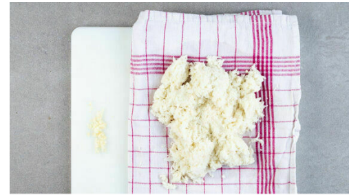
2. Blumenkohlreis auspressen

Die Zwiebeln schälen, halbieren und in feine Streifen schneiden. Die Paprika vierteln, entkernen und in ca. 1cm große Würfel schneiden. Die Oliven in Ringe schneiden.