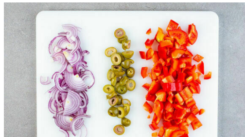
4. Gemüse schneiden

Den Backofen auf 240°C (220°C Umluft) vorheizen. Die Blumenkohle vierteln und grob raspeln. Den Blumenkohlreis in einem großen Topf mit ausreichend Wasser bedecken und abgedeckt bei starker Hitze aufkochen lassen, dann bei niedriger Hitze ca. 3Min. köcheln lassen, bis der Blumenkohlreis gar, aber noch bissfest ist. Anschließend in ein Sieb abgießen und abtropfen lassen.