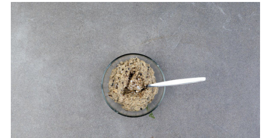
Den Knoblauch schälen und durch eine Knoblauchpresse drücken oder sehr fein würfeln. Die Zitrone halbieren und auspressen. Die Auberginen , das Tahini , die 1/2 des Zitronensaftes und den Knoblauch mit einer Gabel zu einer Creme verrühren. Mit Salz und Pfeffer sowie dem restlichen Zitronensaft abschmecken. Den Salat mit der Auberginencreme garniert servieren.