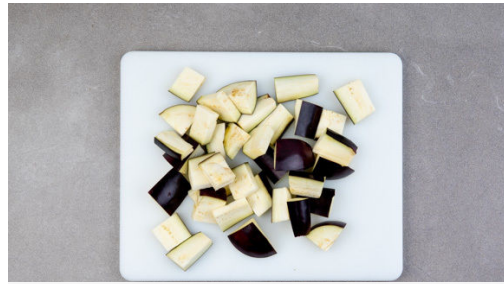
Den Backofen mit Grillfunktion oder Ober-/Unterhitze auf 250°C vorheizen. Die Auberginen je nach Größe der Länge nach vierteln oder sechsteln und jedes Stück quer in 2-2,5cm große Würfel schneiden.

Energie 706kcal, Fett 31.1g, Kohlenhydrate 87.7g, Eiweiß 17.8g