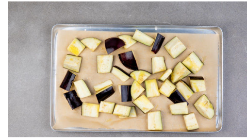
Die Auberginenwürfel auf einem mit Backpapier ausgelegten Backblech mit 3EL Olivenöl und 1-2 kräftigen Prisen Salz vermengen, gleichmäßig verteilen und im Ofen ca. 12Min. grillen bzw. backen, bis die Auberginenstücke weich und gleichmäßig braun sind.