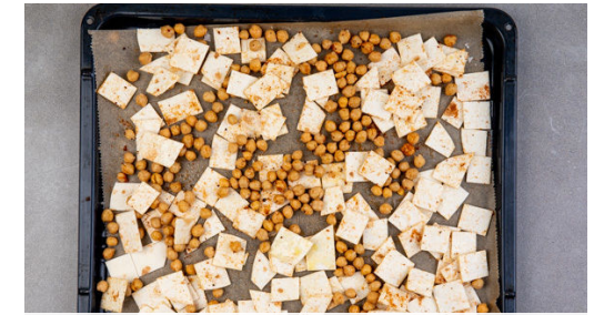
Die Tortillas in ca. 1,5cm breite Streifen und diese in ca. 1,5cm große Vierecke schneiden. Die Kichererbsen in ein Sieb abgießen und mit den Tortillastücken , der Gewürzmischung , 2-3EL Olivenöl sowie je 1 kräftigen Prise Salz und Pfeffer mischen. Alles auf ein zweites mit Backpapier ausgelegtes Backblech geben und 10Min. im Ofen rösten.