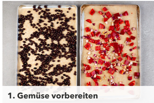
1. Gemüse vorbereiten

Energie 665kcal, Fett 26.1g, Kohlenhydrate 84.6g, Eiweiß 22.8g