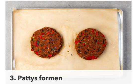
3. Pattys formen

Die Pattys nach 10Min. wenden, mit dem Käse bestreuen und weitere ca. 10Min. backen. Beim Wenden der Pattys die Süßkartoffeln aus dem Ofen holen und etwas abkühlen lassen. Die Brötchen horizontal halbieren und auf einem Backrost im Ofen 2-3Min. aufbacken.