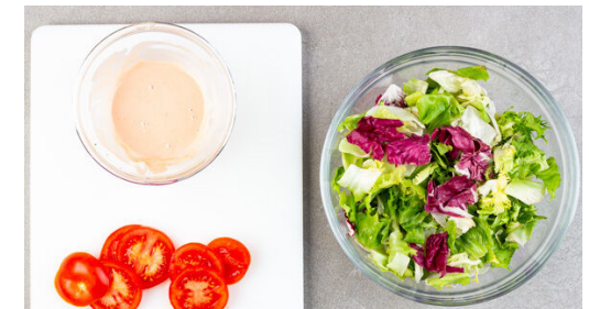
6. Garnitur vorbereiten

Die Süßkartoffeln in den Ofen geben, dabei die Temperatur auf 220°C (200°C) erhöhen. Das Gemüse und die Bohnen mit der Gewürzmischung , den Semmelbröseln , dem Koriander , 3EL Ketchup sowie je 1 Prise Salz und Pfeffer vermengen. Mit einem Stabmixer grob pürieren, die Bohnenmasse zu 4 Pattys formen und auf das zweite Blech legen.