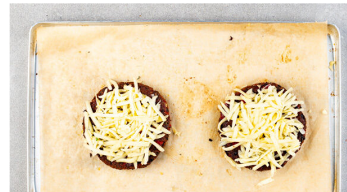
5. Pattys überbacken

Die Bohnen auf einem zweiten mit Backpapier ausgelegten Backblech verteilen. Das Gemüse und die Bohnen ca. 10Min. im Ofen rösten. Die Süßkartoffeln samt Schale in Spalten schneiden, mit 3EL Olivenöl und 2EL Speisestärke vermengen. Das Gemüse und die Bohnen aus dem Ofen nehmen und in einer Schüssel beiseitestellen, die Süßkartoffeln auf einem der Bleche verteilen.