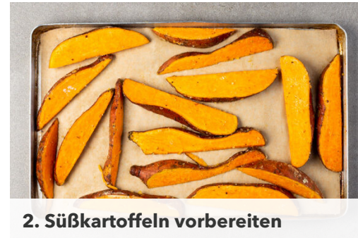
2. Süßkartoffeln vorbereiten

Die Pattys zu den Süßkartoffeln in den Ofen geben und 10Min. mitbacken. Inzwischen die übrige Zwiebel in feine Streifen schneiden und mit 4EL Essig, 1/2TL Salz und 1-2TL Zucker vermengen.