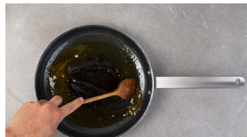
5. Orangensauce zubereiten

Den Brokkoli in mundgerechte Röschen, den Strunk in dünne Scheiben schneiden. Ins kochende Wasser geben und abgedeckt in 8-10Min. bissfest kochen. Ca. 1 Tasse Kochwasser abschöpfen, dann den fertigen Brokkoli in ein Sieb abgießen und abtropfen lassen. Die Orange halbieren, eine Hälfte in dünne Scheiben schneiden, die andere Hälfte auspressen.