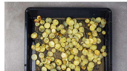
3. Kartoffeln würzen

In der Pfanne den Orangensaft mit 3EL Wasser, 1EL Butter, 1EL Zucker oder Honig sowie je 1 Prise Salz und Pfeffer bei mittlerer Hitze langsam aufkochen. Die Sauce unter Rühren 1-2Min. leicht dicklich einköcheln lassen und mit Salz, Pfeffer und Zucker oder Honig abschmecken.