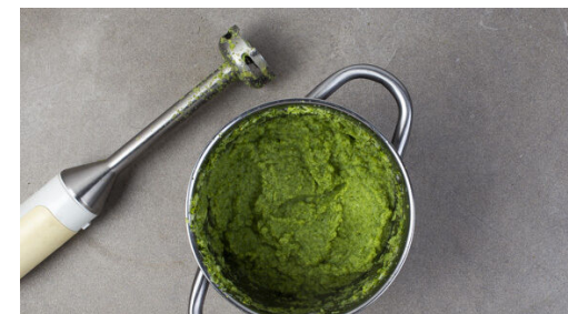
6. Brokkoli pürieren

Die Rosmarinnadeln abstreifen und fein hacken. Den Knoblauch schälen und grob würfeln und mit dem Rosmarin und 2TL Olivenöl verrühren. Die Kartoffeln nach ca. 15Min. Backzeit mit dem Würzöl beträufeln, die Kartoffeln wenden und dabei das Würzöl untermengen. Dann die Kartoffeln fertig backen.