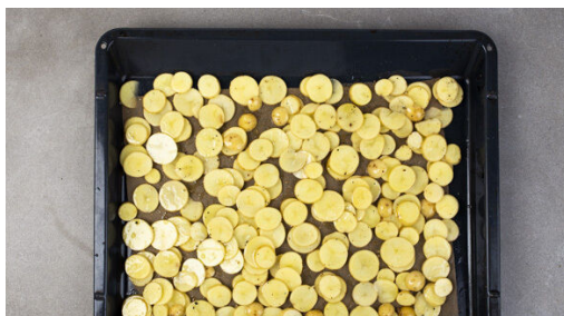
1. Kartoffeln rösten

Energie 674kcal, Fett 35.8g, Kohlenhydrate 50.9g, Eiweiß 34.1g