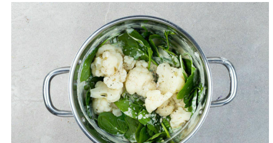
6. Gemüse fertigstellen

Die Zwiebelringe voneinander lösen und in der Stärke wenden. In einer zweiten Pfanne 4EL Olivenöl auf mittlerer Stufe erwärmen und die Zwiebelringe 2-3Min. goldgelb ausbacken. Anschließend auf Küchenkrepp abtropfen lassen und leicht salzen. Tipp: Die Zwiebelringe am besten in zwei oder drei Portionen braten, damit sie schön knusprig werden.