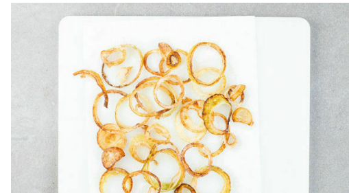
5. Zwiebeln rösten

Das Fleisch trocken tupfen, von beiden Seiten mit Salz und Pfeffer würzen und in einer mittelgroßen Pfanne mit 2EL Olivenöl bei starker Hitze auf jeder Seite 2-4Min. scharf anbraten, je nach Dicke des Fleisches . Die Hitze reduzieren und das Fleisch noch 1-3Min. abgedeckt garen, je nachdem, ob es medium oder durch sein soll. Das Fleisch abgedeckt auf einem Teller ruhen lassen.