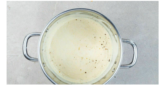
3. Sauce zubereiten

Den Blumenkohl in 2-3cm große Stücke schneiden, in das kochende Wasser geben und in 4-6Min. bissfest kochen. In ein Sieb abgießen und abtropfen lassen.