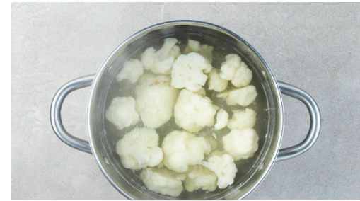
2. Blumenkohl kochen

In einem großen Topf ausreichend gesalzenes Wasser für den Blumenkohl zum Kochen bringen. Die Zwiebeln schälen. 1 Zwiebel halbieren und fein würfeln, die übrigen Zwiebeln in dünne Scheiben schneiden. Den Knoblauch schälen und fein würfeln.