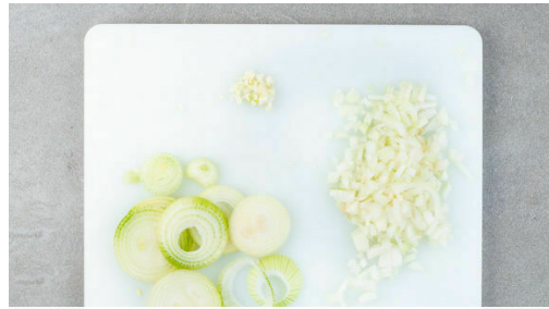
1. Zwiebeln schneiden

Energie 574kcal, Fett 36.9g, Kohlenhydrate 23.0g, Eiweiß 35.0g