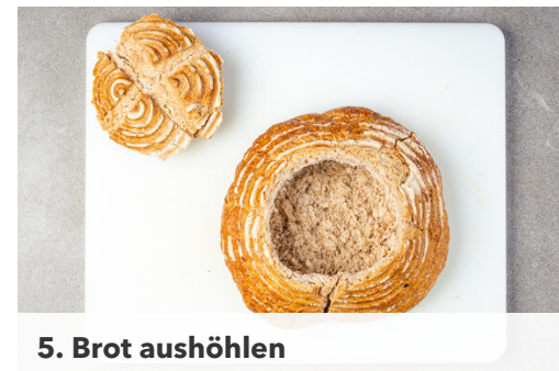
5. Brot aushöhlen

Die 1/2 des Tomatenmarks in die Pfanne geben und bei mittlerer Hitze ca. 1Min. mitbraten, dann mit 250ml Wasser ablöschen und das Ragout abgedeckt ca. 7Min. garen. Anschließend das Ragout noch ohne Deckel 3-4Min. einköcheln, aber nicht zu trocken werden lassen. Mit Salz und Pfeffer abschmecken.