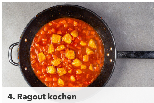
4. Ragout kochen

Das Fleisch trocken tupfen und in mundgerechte Würfel schneiden. Das Fleisch , die Karotten , die Paprika , den Ingwer und den Knoblauch in einer mittelgroßen Pfanne mit 1EL Pflanzenöl, der 1/2 der Gewürzmischung und 2 Prisen Salz bei mittlerer bis starker Hitze ca. 4Min. anbraten.