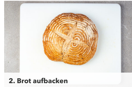
2. Brot aufbacken

Den Backofen auf 180°C (160°C Umluft) vorheizen. Die Karotte ggf. schälen, der Länge nach vierteln und in kleine Würfel schneiden. Die Paprika vierteln, entkernen und ebenfalls in kleine Würfel schneiden. Den Ingwer schälen und fein reiben. Den Knoblauch schälen und grob würfeln.