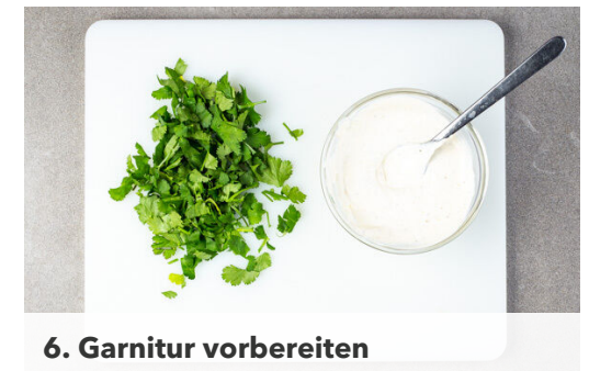
6. Garnitur vorbereiten

Vom Brot einen Deckel abschneiden und das Brot mit einem Löffel vorsichtig aushöhlen. Darauf achten, dass die Unterseite intakt bleibt. Das Brot noch ca. 3Min. im Ofen backen, bis sich die Innenseite leicht geröstet anfühlt. Tipp: Die Brotkrumen trocknen lassen und in einem Mixer zu Semmelbröseln zermahlen.