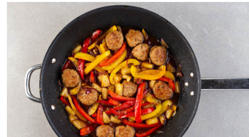
5. Paprika braten

Den Reis in einem Sieb kalt abspülen, bis das Wasser klar bleibt. Sobald das Wasser kocht, den Reis hineingeben und abgedeckt bei niedrigster Hitze 10-12Min. kochen, bis das Wasser aufgesogen und der Reis gar ist. Noch ca. 5Min. ohne Hitzezufuhr ziehen lassen.