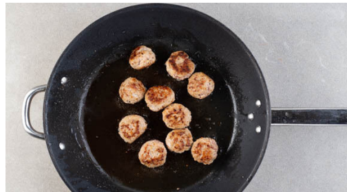
4. Hackbällchen zubereiten

In einem kleinen Topf 400ml leicht gesalzenes Wasser für den Reis zum Kochen bringen. Die Zwiebel schälen und halbieren, eine Hälfte fein würfeln, die andere Hälfte in feine Streifen schneiden. Den Knoblauch schälen und in feine Scheiben schneiden.