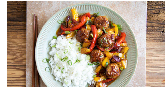
6. Anrichten und servieren

Die Paprika jeweils vierteln, entkernen und in dünne Streifen schneiden. Die Lauchzwiebel in feine Ringe schneiden. Den Ingwer schälen und fein reiben oder sehr fein würfeln.