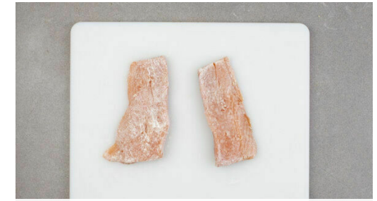
Den Fisch kalt abspülen und trocken tupfen, evtl. vorhandene Gräten mit einer Pinzette entfernen. Den Fisch mit Salz und Pfeffer würzen und in 3-4 EL Mehl wenden.