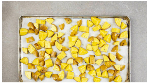
Den Backofen auf 240°C (220°C Umluft) vorheizen. Die Kartoffeln samt Schale würfeln, auf einem mit Backpapier ausgelegten Backblech mit 2EL Olivenöl vermengen und mit Salz würzen, ggf. ein zweites Blech verwenden. Im Ofen in 20-25Min. goldbraun backen, nach der Hälfte der Zeit wenden und ggf. die Bleche tauschen.

Energie 699kcal, Fett 31.3g, Kohlenhydrate 60.7g, Eiweiß 38.1g