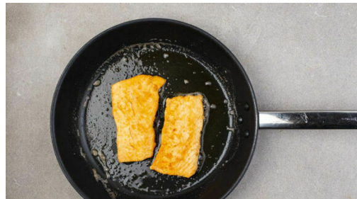
Ggf. überschüssiges Mehl abschütteln und den Lachs auf der Haut in einer großen Pfanne mit 2EL Olivenöl oder Butter bei mittlerer Hitze ca. 4Min. kross anbraten, dann wenden und noch mal ca. 2Min. braten, er muss nicht vollständig durchgegart sein. Aus der Pfanne nehmen und beiseitestellen, die Pfanne nicht auswaschen.