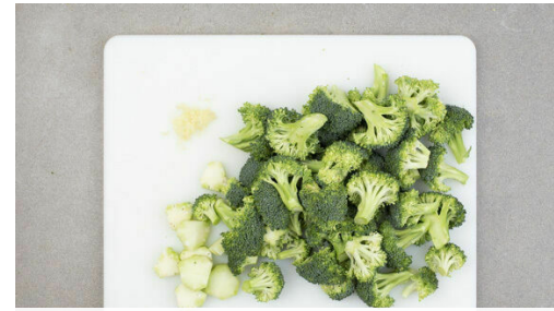
Den Brokkoli in mundgerechte Röschen schneiden, den Strunk ggf. schälen und in dünne Scheiben schneiden. Den Knoblauch schälen und fein würfeln.