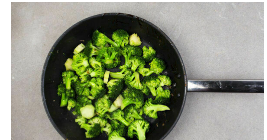
Den Brokkoli und den Knoblauch in der Pfanne bei mittlerer Hitze ca. 2Min. unter Rühren anbraten, mit 2-3EL Wasser ablöschen und abgedeckt in 3-4Min. bissfest garen. Den Brokkoli mit Salz und Pfeffer abschmecken und mit den Röstkartoffeln zum Teriyaki-Lachs servieren.