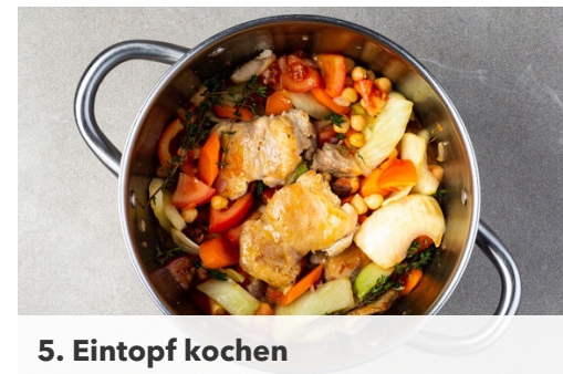
5. Eintopf kochen

Den Fenchel , die Karotten , die Zwiebeln und den Knoblauch in dem Topf bei mittlerer bis starker Hitze ca. 3Min. anbraten. Das Gemüse mit 1/2TL Salz würzen.