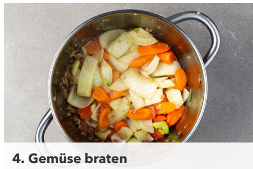
4. Gemüse braten

Den Fenchel , die Karotten , die Zwiebeln und den Knoblauch in dem Topf bei mittlerer bis starker Hitze ca. 3Min. anbraten. Das Gemüse mit 1/2TL Salz würzen.