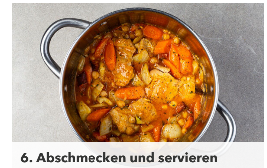
6. Abschmecken und servieren

Die Tomaten , das Fleisch , die Chorizo , die Kichererbsen samt Flüssigkeit und die Thymianzweige in den Topf geben und den Eintopf abgedeckt ca. 10Min. bei mittlerer Hitze köcheln lassen.