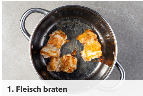
1. Fleisch braten

Energie 684kcal, Fett 31.3g, Kohlenhydrate 44.0g, Eiweiß 51.0g