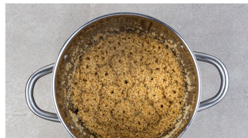
2. Quinoa kochen

Die Zwiebel schälen, halbieren und in feine Streifen schneiden. Die Peperoni längs halbieren und in fein würfeln. Tipp: Für weniger Schärfe die Kerne entfernen. Die Limette und die Orange halbieren, auspressen und den Saft mit den Zwiebeln , der Peperoni und 1 Prise Salz zu einem Dressing verrühren. Den Koriander samt Stängeln fein schneiden.