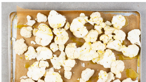
1. Blumenkohl schneiden

Energie 701kcal, Fett 28.8g, Kohlenhydrate 90.3g, Eiweiß 21.4g