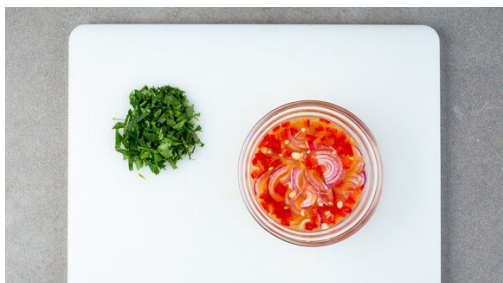
4. Dressing zubereiten

Den Backofen mit Grillfunktion oder Ober-/Unterhitze auf 250°C vorheizen. In einem kleinen Topf 450ml leicht gesalzenes Wasser für die Quinoa zum Kochen bringen. Den Blumenkohl in mundgerechte Röschen schneiden und auf ein mit Backpapier ausgelegtes Backblech geben.