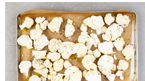
3. Blumenkohl rösten

Die Mandarine schälen und die Segmente trennen. Die Radieschen in dünne Scheiben schneiden und mit den Mandarinenstücken und dem Dressing vermengen.