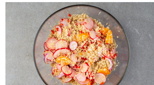
6. Quinoa untermengen

Den Blumenkohl mit 2EL Olivenöl und 1 Prise Salz und Pfeffer vermengen, gleichmäßig verteilen und 10-12Min. auf der mittleren Schiene im Ofen rösten. Der Blumenkohl sollte eine schöne goldene Farbe bekommen. Nach der Hälfte der Zeit einmal wenden.