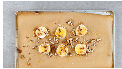
Die Pekannüsse grob hacken. Den Käse in 6-8 Scheiben schneiden und auf mit Backpapier ausgelegtes Backblech legen. Mit 1-2TL Honig bestreichen und mit 1 Prise Ras el-Hanout würzen, dann mit den Nüssen bestreuen und 6-8Min. im Ofen backen, bis der Käse warm ist und die Nüsse goldbraun sind.