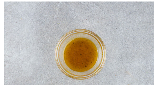
Die Zitronenschale fein abreiben, dann die Zitrone halbieren und auspressen. 1EL Olivenöl, 2EL Zitronensaft , 1TL Zitronenabrieb , das restliche Ras el-Hanout und 1TL Honig zu einem Dressing verrühren und kräftig mit Salz und 1 Prise Pfeffer abschmecken.