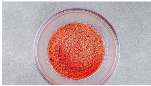
Den Backofen auf 220°C (200°C Umluft) vorheizen. In einem Wasserkocher 400ml Wasser aufkochen. Tipp: Die nach Wasserkocher variierende Mindestmenge beachten und ggf. mehr Wasser aufkochen. Den Couscous mit der 1/2 des Brühgewürzes , dem Rote-Bete-Saft und dem kochenden Wasser verrühren und abgedeckt 8-10Min. quellen lassen.

Energie 882kcal, Fett 31.6g, Kohlenhydrate 124.0g, Eiweiß 29.1g