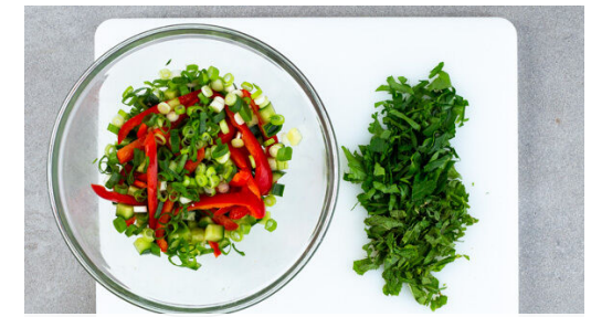
Die Paprika halbieren, entkernen und in dünne Streifen schneiden. Die 1/2 der Gurke oder mehr nach Geschmack in kleine Würfel schneiden. Die Lauchzwiebel in feine Ringe schneiden. Alles in eine große Schüssel geben. Die Minzeblätter abzupfen und fein schneiden. Die Petersilie samt Stängeln fein hacken.