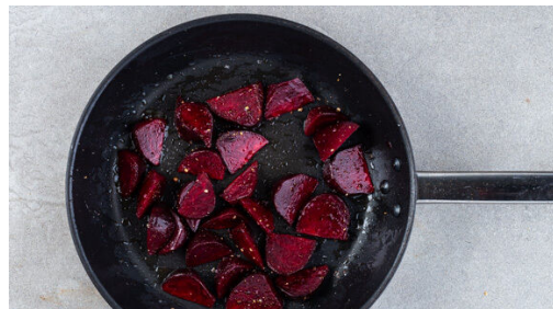
Die Rote Bete in Spalten schneiden und in einer mittelgroßen Pfanne mit 1TL Olivenöl bei mittlerer Hitze 4-5Min. erwärmen. Mit Salz und Pfeffer würzen.