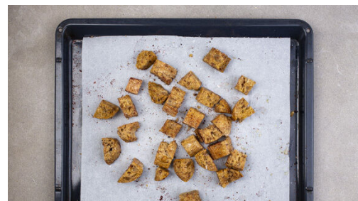
2. Brot rösten

Den Fenchel in einer großen Pfanne mit 1EL Olivenöl bei mittlerer Hitze 5-7Min. braten, bis er anfängt, weich zu werden. Die Bohnen zufügen und 2-3Min. mitgaren. Die Pfanne vom Herd nehmen und das Gemüse mit Salz und Pfeffer abschmecken.