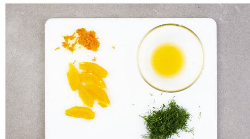
5. Orangen vorbereiten

Das Brötchen grob würfeln und auf einem zweiten mit Backpapier ausgelegten Backblech mit 1EL Olivenöl, dem Sumach und je 1 Prise Salz und Pfeffer vermengen. Im Ofen in 6-8Min. knusprig backen, nach der Hälfte der Backzeit wenden.