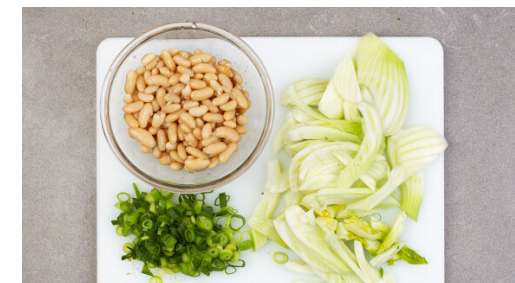
3. Zutaten vorbereiten

Die Schale 1 Orange abreiben, dann die Orange halbieren und auspressen. Die übrige Orange so schälen, dass auch die weiße Haut entfernt wird, und das Fruchtfleisch in Spalten schneiden. Die Dillspitzen abzupfen und grob schneiden.