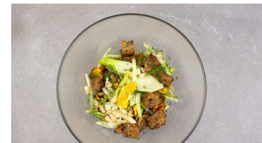
6. Salat fertigstellen

Die Bohnen in einem Sieb kalt abspülen und abtropfen lassen. Den Fenchel in dünne Streifen schneiden. Die Lauchzwiebel in feine Ringe schneiden. Tipp: Sehr dekorativ wirkt es, wenn die Lauchzwiebel schräg geschnitten wird.