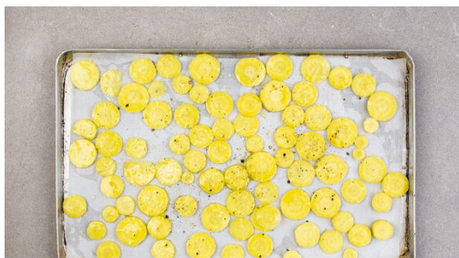
1. Gelbe Bete backen

Energie 700kcal, Fett 32.6g, Kohlenhydrate 73.5g, Eiweiß 21.2g