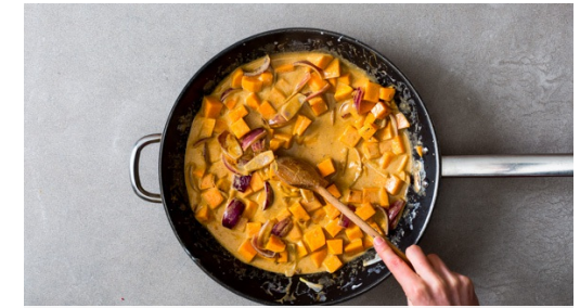
Je nach Schärfewunsch ca. 1/3 der Tikka-Masala-Paste untermischen und alles einmal aufkochen lassen. Die Hitze reduzieren und das Curry abgedeckt 15-18Min. köcheln lassen, bis die Süßkartoffeln gar, aber nicht zercocht sind.