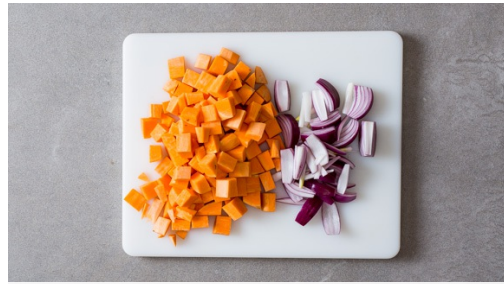
Die Süßkartoffel schälen und in 1-2cm große Würfel schneiden. Die Karotte ggf. schälen und in gleich große Würfel schneiden. Die Zwiebel schälen, halbieren und in ca. 1cm breite Spalten schneiden.

Allergene Erdnüsse (5). Kann Spuren von anderen Allergenen enthalten.