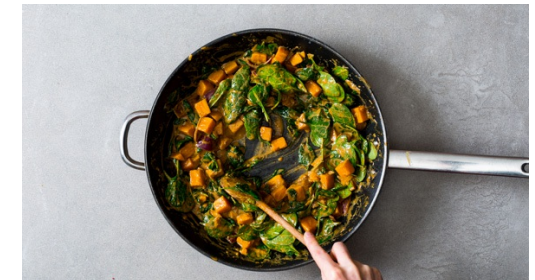
Das Curry nach Geschmack mit der Tamarindenpaste sowie Salz und Pfeffer würzen. Den Spinat unterheben und zusammenfallen lassen. Das Curry auf dem Reis anrichten und mit den Erdnüssen garniert servieren.