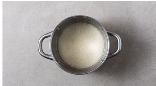
Den Reis in einem Sieb kalt abspülen, bis das Wasser klar bleibt, dann in das kochende Wasser geben und auf niedrigster Stufe abgedeckt 10-12Min. kochen, bis das Wasser aufgesogen und der Reis bissfest ist. Noch ca. 5Min. ohne Hitzezufuhr ziehen lassen.