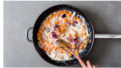
Die Süßkartoffeln , die Karotten und die Zwiebeln in einer großen Pfanne mit 1EL Pflanzenöl bei starker Hitze 2-3Min. anbraten, dann mit der Kokosmilch und 150ml Wasser ablöschen. In einem kleinen Topf 300ml leicht gesalzenes Wasser für den Reis zum Kochen bringen.