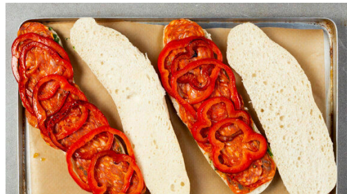
Die Brötchen aufschneiden und mit den Schnittflächen nach oben auf ein mit Backpapier ausgelegtes Backblech geben. Die unteren Brötchenhälften mit etwas Kräutersauce bestreichen und mit der Salami und den Paprikaringen belegen. Das Blech für 7-8Min. in den Ofen geben.