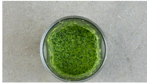
Den Backofen auf 200°C (180°C Umluft) vorheizen. Den Knoblauch schälen und fein würfeln. Die Rosmarinnadeln von den Stängeln zupfen und mit den übrigen Kräutern , dem Knoblauch , 2-3EL Olivenöl, 2EL Essig, 2EL Wasser, je 1 /2TL Salz und Pfeffer und 1 Prise Zucker in einem hohen Gefäß möglichst glatt pürieren.

Allergene Gluten (1), Eier (3). Kann Spuren von anderen Allergenen enthalten.