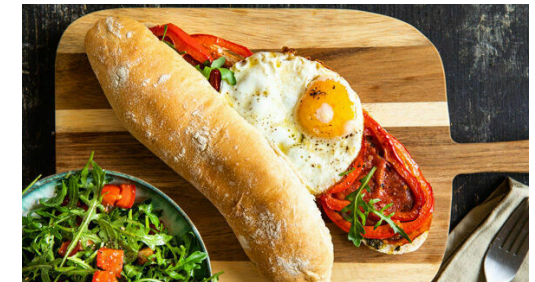
3/4 der übrigen Kräutersauce mit dem Rucola vermengen. Auf den belegten Brötchenhälften jeweils 1 Spiegelei anrichten. Mit etwas Rucola garnieren und nach Geschmack mit der restlichen Kräutersauce beträufeln, dann mit den oberen Brötchenhälften abdecken. Die Tomaten und ggf. übrige Paprika mit dem übrigen Rucola mischen und zu den Sandwiches servieren.