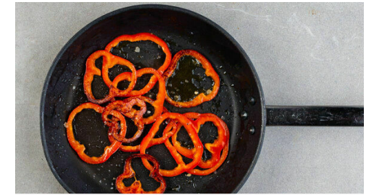
Die Paprikaringe in einer großen Pfanne mit 1EL Olivenöl bei starker Hitze 3-4Min. braten, bis sie weich ist und einige Röstspuren aufweist. Dabei gelegentlich wenden. Mit je 1 Prise Salz und Pfeffer würzen und aus der Pfanne nehmen.