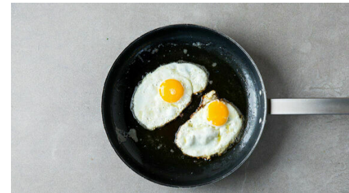
Die Eier in der Pfanne mit 2EL Olivenöl bei mittlerer bis starker Hitze 3-4Min. braten, bis die Unterseiten knusprig und die Eier gar sind. Mit Salz und Pfeffer würzen. Tipps: Die Eier nach dem Aufschlagen zunächst in eine Schüssel geben, um ggf. Schalenreste leichter entfernen zu können. Für festeres Eiweiß oder Eigelb einen Deckel auf die Pfanne geben.