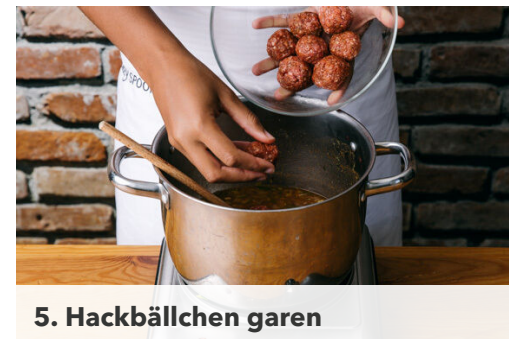
5. Hackbällchen garen

Die 1/2 des Tomatenmarks zum Gemüse in den Topf geben und kurz mitbraten, dann mit 1,2L heißem Wasser ablöschen. Das Brühgewürz und 2TL Salz unterrühren und den Eintopf bei niedrigster Hitze 3-4Min. sanft köcheln lassen.