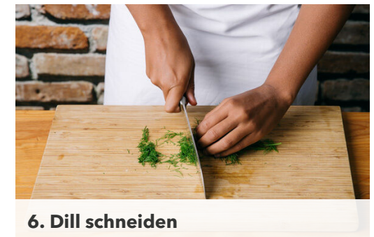
6. Dill schneiden

Das Hackfleisch mit dem restlichen Knoblauch , dem restlichen Tomatenmark , 1TL Salz und 1 kräftigen Prise Pfeffer verkneten und mit feuchten Händen zu walnussgroßen Bällchen formen. Die Hackbällchen in den Eintopf geben und 10-15Min. mitgaren. Nach der Hälfte der Zeit die Bohnen , die 1/2 des Paprikapulvers und die 1/2 der Gewürzmischung zugeben.