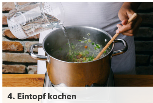
4. Eintopf kochen

In einem großen Topf 2EL Pflanzenöl bei starker Hitze erwärmen. Den Lauch , die Zwiebeln , die Karotten und die Knoblauchscheibchen in das heiße Öl geben, mit 2EL Mehl bestäuben und 2-3Min. scharf anbraten, bis leichte Röstspuren zu sehen sind.