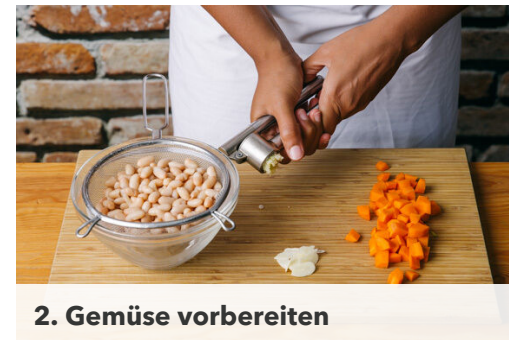
2. Gemüse vorbereiten

Die Zwiebeln schälen, halbieren und grob würfeln.