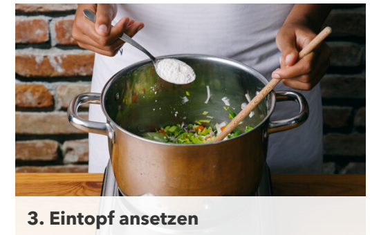
3. Eintopf ansetzen

Die Karotten ggf. schälen, längs vierteln und in kleine Würfel schneiden. Den Knoblauch schälen, 2 Knoblauchzehen in feine Scheibchen schneiden, den übrigen Knoblauch durch eine Knoblauchpresse drücken oder sehr fein würfeln. Die Bohnen in einem Sieb kalt abspülen und abtropfen lassen.