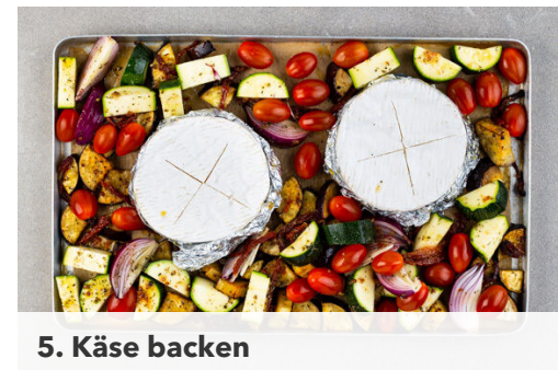
5. Käse backen

Die Zucchini längs halbieren und quer in dünne Scheiben schneiden. Die Zwiebeln schälen und in Spalten schneiden, dann mit der Zucchini und der restlichen Tomatenmischung vermengen.