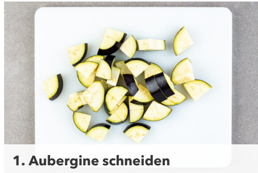
1. Aubergine schneiden

Energie 575kcal, Fett 42.4g, Kohlenhydrate 17.9g, Eiweiß 30.6g