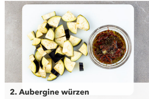
2. Aubergine würzen

Den Backofen auf 220°C (200°C Umluft) vorheizen. Die Aubergine der Länge nach vierteln, dann quer in ca. 1cm dicke Scheiben schneiden.