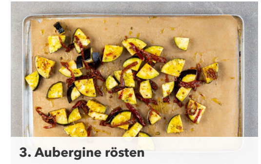
3. Aubergine rösten

Die getrockneten Tomaten in Streifen schneiden. Den Knoblauch schälen und fein würfeln. Die getrockneten Tomaten und den Knoblauch mit den Provence-Kräutern , 4-5EL Olivenöl, 2TL Essig, 1TL Salz und 1 kräftigen Prise Pfeffer verrühren, dann die 1/2 der Tomatenmischung mit den Auberginen vermengen.