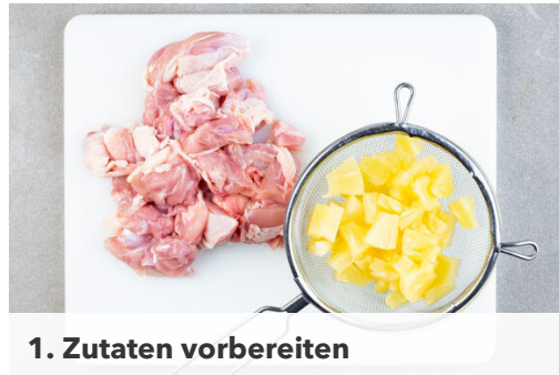
1. Zutaten vorbereiten

Energie 1029kcal, Fett 41.8g, Kohlenhydrate 98.0g, Eiweiß 63.0g