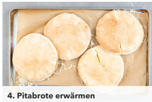
4. Pitabrote erwärmen

4 Pitabrote mit einigen Tropfen Wasser befeuchten, dann gleichmäßig mit dem Käse füllen. Auf einem mit Backpapier ausgelegten Backblech 4-5Min. im Ofen erwärmen, bis der Käse geschmolzen ist, die Brote sollen aber nicht zu knusprig werden. Tipp: Das übrige Brot kann eingefroren werden.