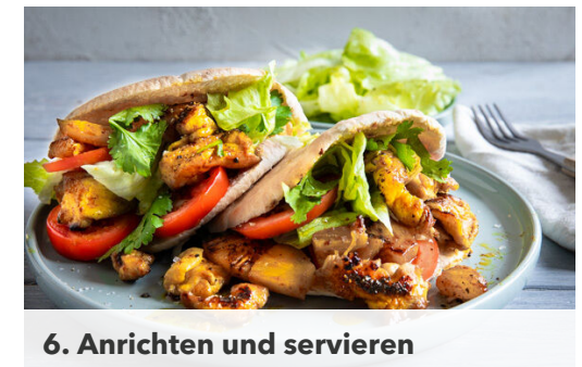
6. Anrichten und servieren

Die 1/2 des Salats in feine Streifen schneiden. Der übrige Salat wird für dieses Rezept nicht benötigt. Den Koriander samt Stängeln fein schneiden.