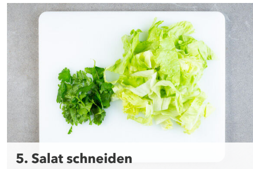
5. Salat schneiden

4 Pitabrote mit einigen Tropfen Wasser befeuchten, dann gleichmäßig mit dem Käse füllen. Auf einem mit Backpapier ausgelegten Backblech 4-5Min. im Ofen erwärmen, bis der Käse geschmolzen ist, die Brote sollen aber nicht zu knusprig werden. Tipp: Das übrige Brot kann eingefroren werden.