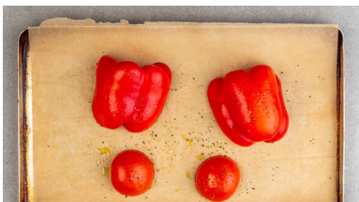
1. Gemüse vorbereiten

Energie 902kcal, Fett 41.6g, Kohlenhydrate 91.8g, Eiweiß 32.6g