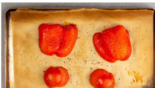
2. Gemüse backen

Die Tomatenhaut ablösen und entfernen. Die Paprika , die Tomaten , die ½ der Gewürzmischung , 2EL Olivenöl, ½EL Zitronensaft , die ½ der Zitronenschale , ½TL Zucker , je 1 kräftige Prise Salz und Pfeffer und 1-2EL Pastawasser in einem hohen Gefäß zu einer glatten Sauce pürieren. Ggf. mit mehr Gewürzmischung abschmecken.