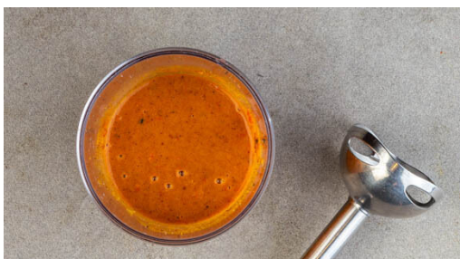
4. Sauce zubereiten

Den Backofen mit Grillfunktion oder Ober-/Unterhitze auf 250°C vorheizen. In einem mittelgroßen Topf ausreichend gesalzenes Wasser für die Pasta zum Kochen bringen. Die Paprika längs halbieren und entkernen. Die Tomate halbieren. Die Paprika und die Tomaten auf ein mit Backpapier ausgelegtes Blech geben und mit 1EL Olivenöl und je 1 Prise Salz und Pfeffer würzen.