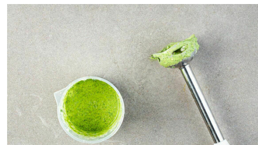
5. Pesto pürieren

Die Gnocchi in einer zweiten großen Pfanne mit 2EL Olivenöl bei mittlerer bis starker Hitze 6-8Min. braten, dabei ab und zu umrühren. Mit je 1 kräftigen Prise Salz und Pfeffer würzen. Tipp: Je nach Größe der Pfanne in zwei Durchgängen arbeiten oder eine zusätzliche Pfanne verwenden.