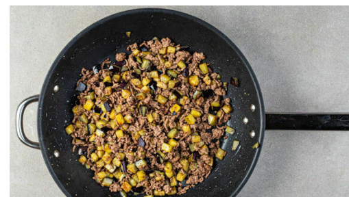
2. Hackfleisch braten

Die Auberginen in ca. 1cm große Würfel schneiden. Die Tomaten in 2-3cm große Stücke schneiden und den Knoblauch schälen.