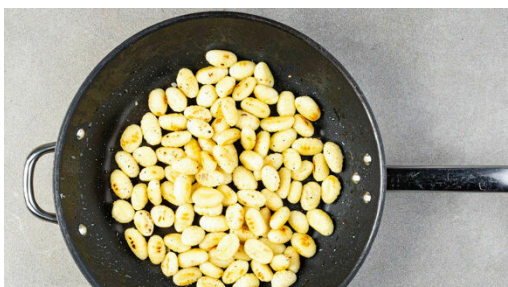
4. Gnocchi braten

Die Tomaten , das Ras el-Hanout sowie 5-6EL Wasser in die Pfanne geben und bei mittlerer Hitze 14-16Min. köcheln lassen, bis das Gemüse gar ist. Bei Bedarf etwas mehr Wasser zugeben.