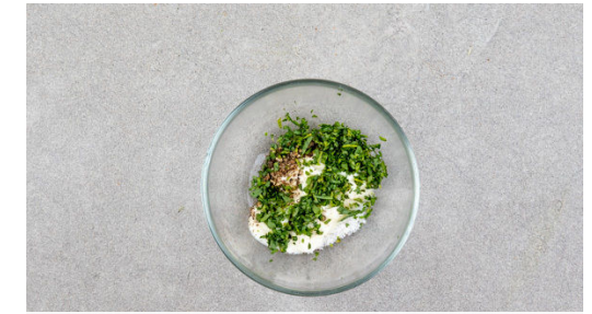
3. Dip zubereiten

Den Spargel in einer großen Pfanne mit 3EL Olivenöl bei mittlerer bis starker Hitze 3-4Min. rundum anbraten. Die Zwiebeln und den Knoblauch hinzugeben und ca. 2Min. mitbraten. Dann die Tomaten untermischen und kurz erwärmen. Das Gemüse mit Salz, Pfeffer und ½TL Zucker würzen.