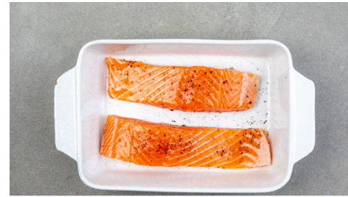
2. Lachs garen

Die hölzernen Enden des Spargels abschneiden. Die Zwiebeln schälen, halbieren und in feine Streifen schneiden. Den Knoblauch schälen und in feine Scheibchen schneiden. Die Kirschtomaten halbieren.