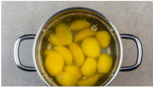
1. Kartoffeln kochen

Energie 725kcal, Fett 43.6g, Kohlenhydrate 47.7g, Eiweiß 32.4g