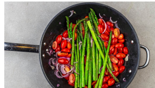
5. Gemüse braten

Den Fisch mit kaltem Wasser abspülen, trocken tupfen und evtl. vorhandene Gräten und Schuppen entfernen. Rundum mit 2EL Olivenöl einreiben, mit 1 kräftigen Prise Pfeffer würzen und mit der Hautseite nach unten in eine Auflaufform geben. Im Ofen ca. 30Min. backen, bis der Fisch in der Mitte gar ist.