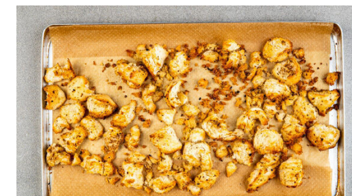
6. Croûtons backen

Das Fetapäckchen zur Paprika auf das Blech geben und beides im Ofen 10-15Min. backen, bis die Paprika gar ist und der Feta weich wird. In den letzten 3-5Min. das Fetapäckchen öffnen, damit der Feta goldbraun wird.