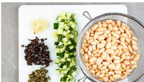
4. Gemüse schneiden

Den Backofen auf 240°C (220°C Umluft) vorheizen. Die gelbe Paprika jeweils achtern und entkernen, die rote Paprika jeweils entkernen und quer in ca. 0,5cm dicke Ringe schneiden. Beide auf einem mit Backpapier ausgelegten Backblech mit 1EL Olivenöl und je 1 kräftigen Prise Salz und Pfeffer vermengen, auf einer Seite des Blechs etwas Platz lassen.