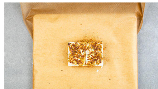
2. Feta einpacken

Die Bohnen in einem Sieb mit kaltem Wasser abspülen und abtropfen lassen. Den Knoblauch schälen und fein würfeln. Die Oliven und die Kapern fein schneiden. Die Gurken in ca. 2cm große Würfel schneiden.