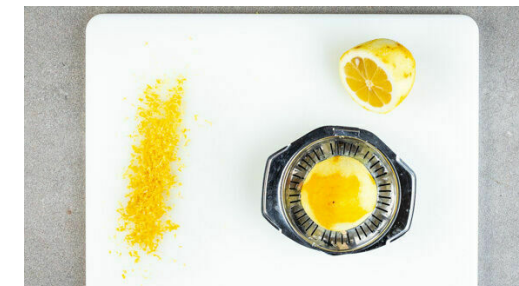
3. Zitrone vorbereiten

Die Walnüsse in einer mittelgroßen Pfanne ohne Zugabe von Fett bei mittlerer Hitze 1-2Min. anrösten. Vorsicht , sie können schnell zu dunkel werden. Aus der Pfanne nehmen und kurz abkühlen lassen. Die Basilikumblätter abzupfen und mit den Walnüssen sowie der Zitronenschale fein hacken, dann mit 1EL Olivenöl vermengen. Die Gremolata mit je 1 Prise Salz und Pfeffer würzen.