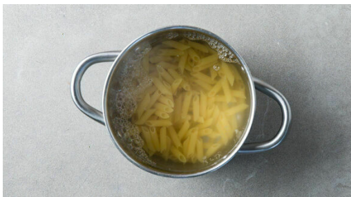
4. Pasta kochen

Den Backofen auf 220°C (200°C Umluft) vorheizen. In einem großen Topf ausreichend gesalzenes Wasser für die Pasta zum Kochen bringen. Die Zucchini längs vierteln, dann in 1-2cm große Stücke schneiden. Den Knoblauch schälen und grob würfeln.