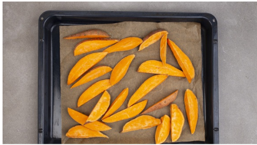
1. Süßkartoffeln vorbereiten

Energie 680kcal, Fett 30.4g, Kohlenhydrate 80.0g, Eiweiß 15.4g