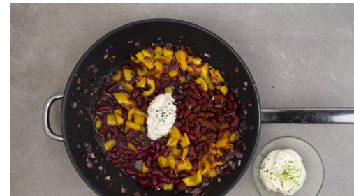
5. Chili verfeinern

Die Paprika , die Zwiebeln und den Knoblauch in einer großen Pfanne mit 2EL Olivenöl bei hoher Hitze 2-3Min. anbraten, bis das Gemüse weich ist. Die Bohnen und die Gewürzmischung unterrühren und alles bei mittlerer Hitze 6-8Min. sanft köcheln lassen. Die 1/2 der Bohnenflüssigkeit unter das Chili rühren, bei Bedarf auch etwas mehr.