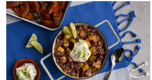
6. Anrichten und servieren

Die Limettenschale abreiben. Eine Limette auspressen, die andere in Spalten schneiden. Den Limettensaft mit 1EL Schmand unter das Chili rühren, mit Salz und Pfeffer abschmecken. Den restlichen Schmand mit dem Limettenabrieb und 1 Prise Salz zu einem Dip verrühren.