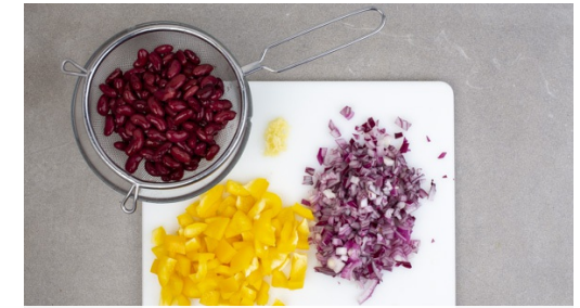
3. Gemüse schneiden

1-2TL Paprikapulver mit 1-2EL Olivenöl, Salz und Pfeffer verrühren und mit den Süßkartoffeln vermengen. Im Ofen 20-25Min. rösten, bis die Süßkartoffeln goldbraun und knusprig sind.