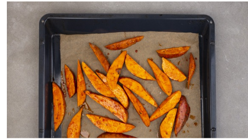
2. Süßkartoffeln rösten

Den Backofen auf 200°C Umluft (220°C Ober-/Unterhitze) vorheizen. Die Süßkartoffeln längs halbieren, in 1-2cm dicke Spalten schneiden und auf ein mit Backpapier ausgelegtes Backblech geben.